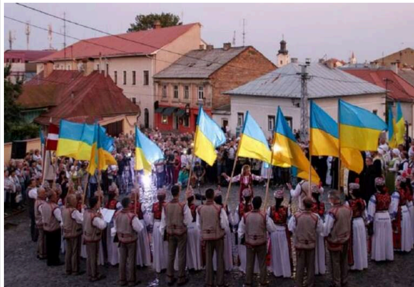
Із Закарпаття емігрували 300 тисяч осіб, - ОВА