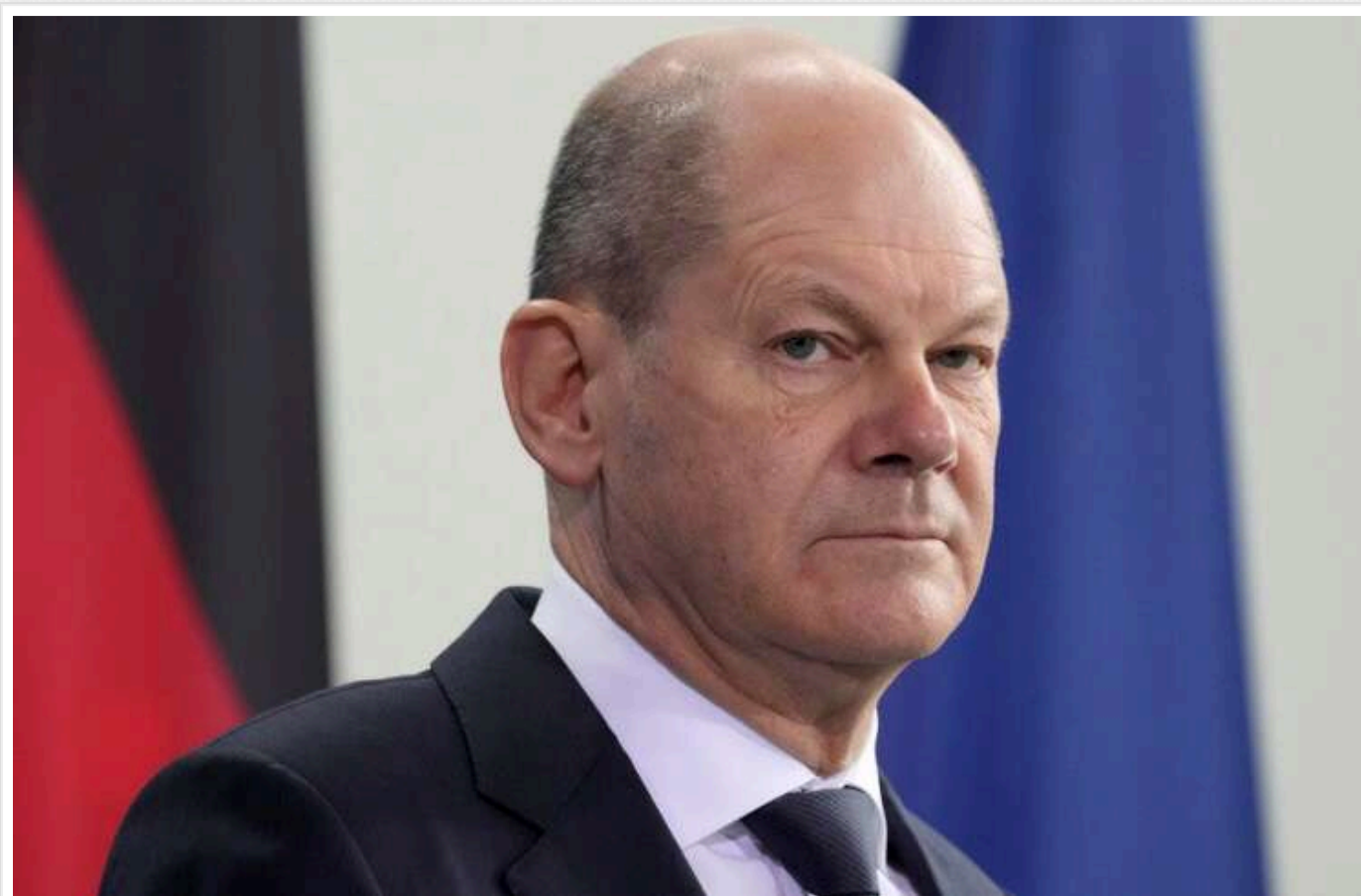
Der Spiegel: У Німеччині готувалися до розмови з Путіним "протягом кількох тижнів"

Як повідомляє Der Spiegel, відомство канцлера Німеччини Олафа Шольца "протягом кількох тижнів готувалося до телефонної розмови з Путіним".