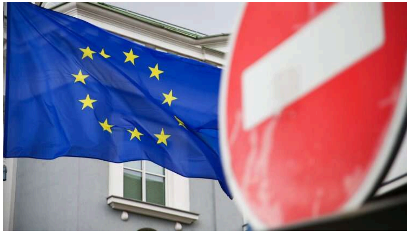
ЄС готує санкції проти Китаю за допомогу РФ у війні: уперше відправили зброю

Європейський Союз розглядає можливість введення санкцій проти Китаю через те, що країна вперше передала Росії зброю для використання проти України. У ЄС є "переконливі" докази щодо цієї поставки.