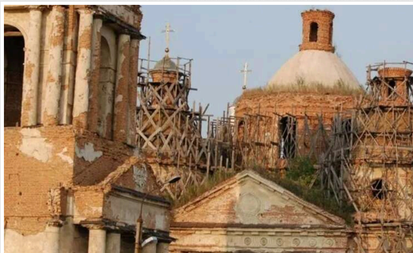
Унаслідок російських обстрілів на Сумщині було зруйновано пам'ятку національного значення

Постійні російські обстріли Сумщини пошкодили пам'ятку національного значення, церкву Різдва Пресвятої Богородиці, збудовану понад 200 років тому.