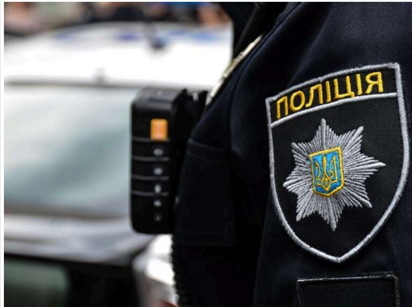
Стрільянина під Києвом: в поліції стверджують, що це був "представник добровольчого формування, який перебував у групі оповіщення"

Поліція продовжує стверджувати, що в чоловіка сьогодні під Києвом стріляв не співробітник ТЦК, як заявляє Міноборони України, а "представник добровольчого формування, що перебував у групі оповіщення".