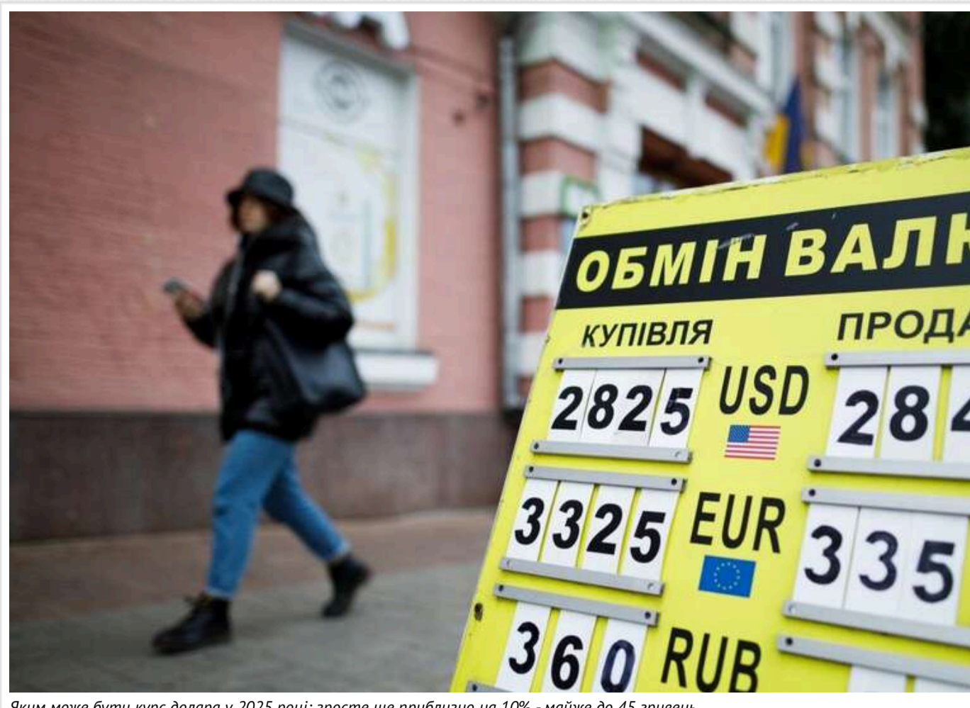
Яким може бути курс долара у 2025 році: зросте ще приблизно на 10% - майже до 45 гривень

Упродовж наступних 12 місяців курс долара збільшиться ще приблизно на 10%. Такі прогнози надають фінансові аналітики, банкіри, керівники підприємств та населення.