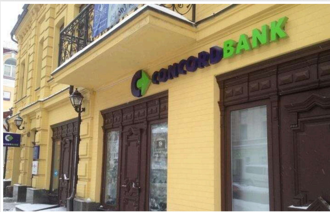
Гетманцев: Власники ліквідованого банку "Конкорд" не повертають гроші державі

Кошти ліквідованого через серйозні порушення банку "Конкорд" так і не були передані до держбюджету України. Власники банку заблокували стягнення коштів, які фінустанова заборувала державі, через суд за допомогою заборони на проведення податкових перевірок.