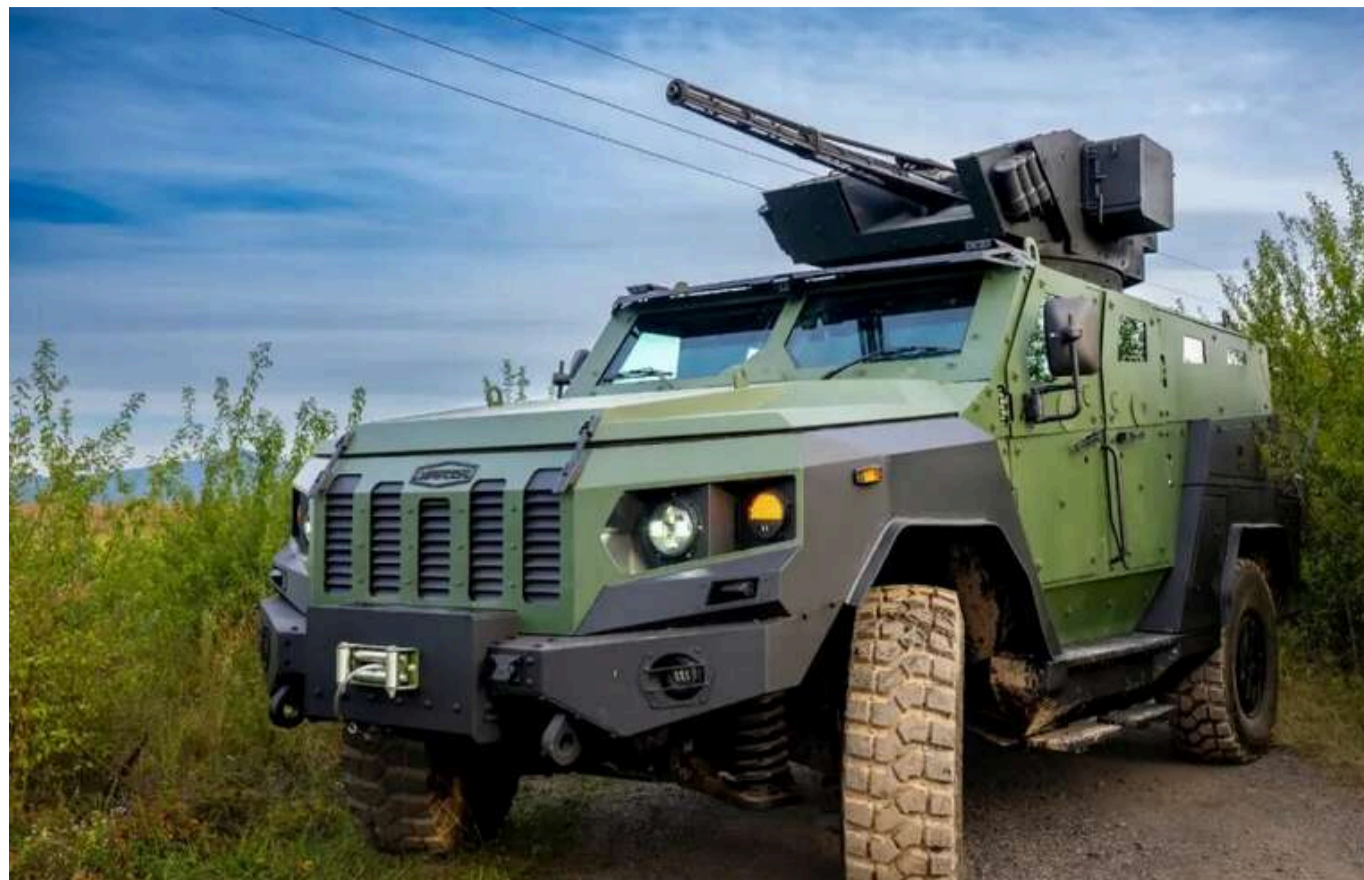
В Міноборони допустили для використання у ЗСУ броневтомобіль підвищеної прохідності "Зубр"

Міністерство оборони України затвердило та допустило до використання в підрозділах Сил оборони повнопривідний броневтомобіль високої прохідності "Зубр". Цей багатоцільовий транспортний засіб відзначається високою мобільністю, маневровістю та компактністю.