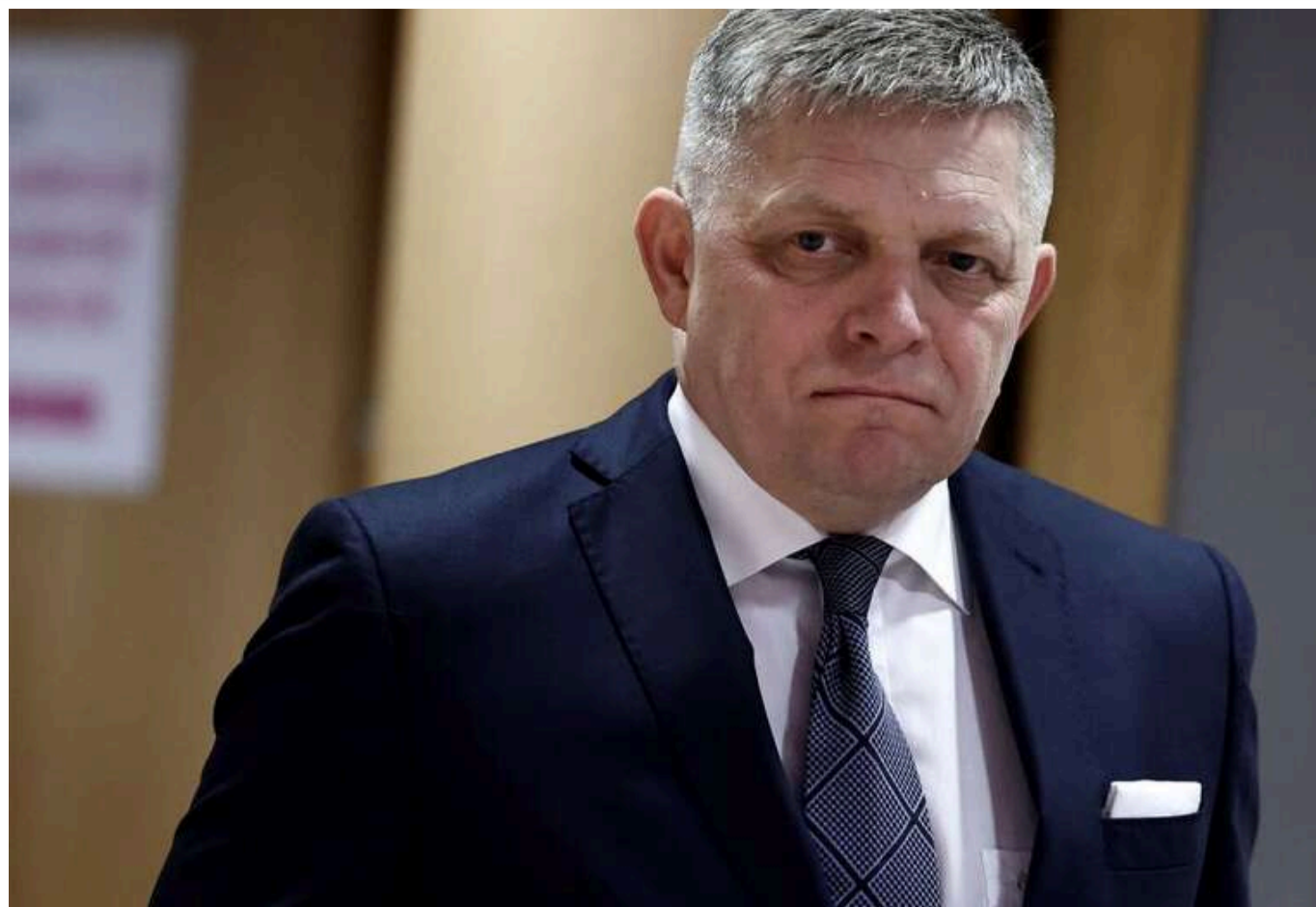
Проросійський уряд Роберта Фіцо ризикує втратити владу

На початку листопада цього року загострився розкол у партійній коаліції парламенту Словаччини, що може призвести до позачергових виборів у країні. Зважаючи на поступове зниження популярності політики чинного уряду, це може загрожувати проросійському очільнику Словаччини, прем'єр-міністру Роберту Фіцо, втрапою посади, і, як наслідок, змінами у зовнішній політиці офіційної Братислави.