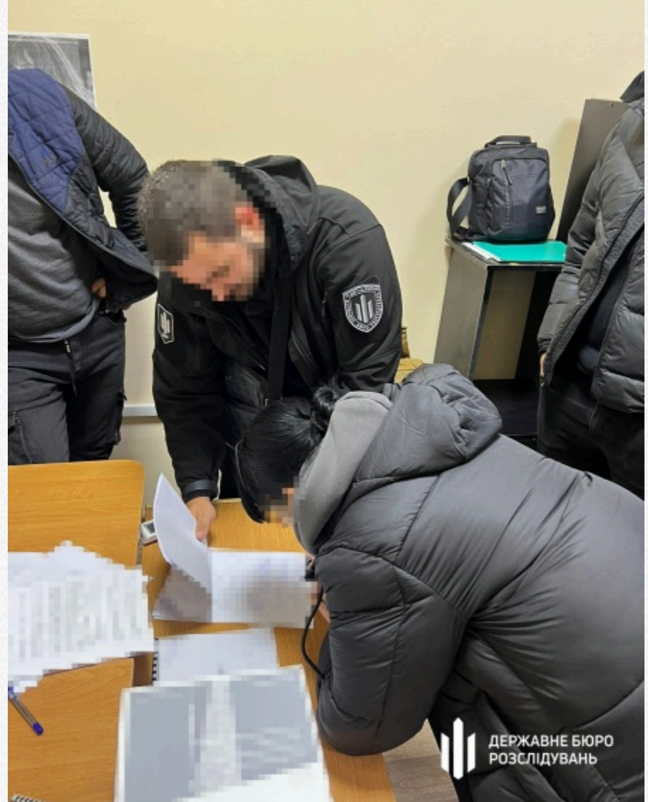
Державне бюро розслідувань