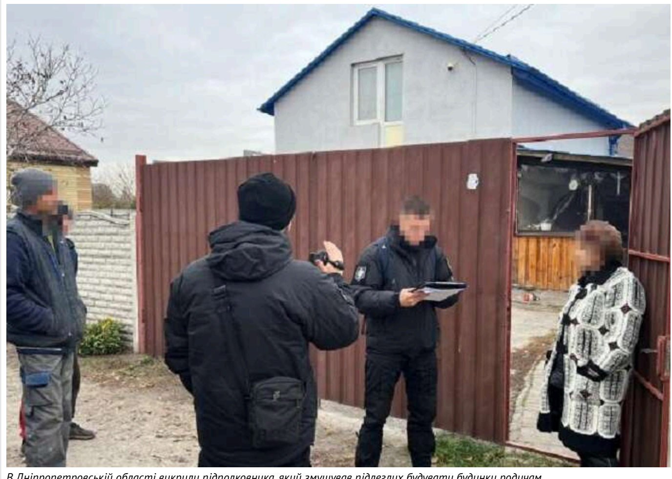
В Дніпропетровській області викрили підполковника, який змушував підлеглих будувати будинки родичам

У Дніпропетровській області викрили командира військової частини. Підполковник примушував своїх підлеглих будувати будинки для своїх родичів.