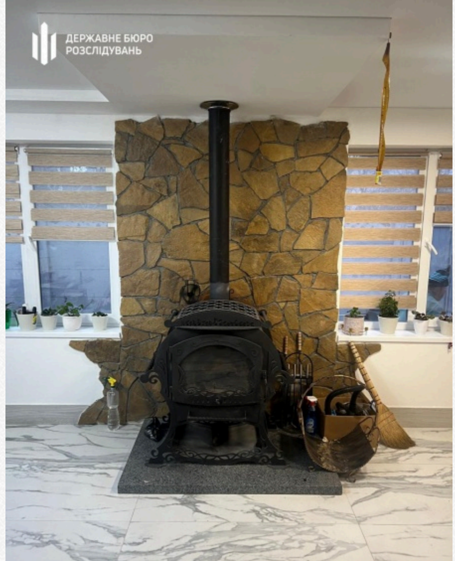
Державне бюро розслідувань