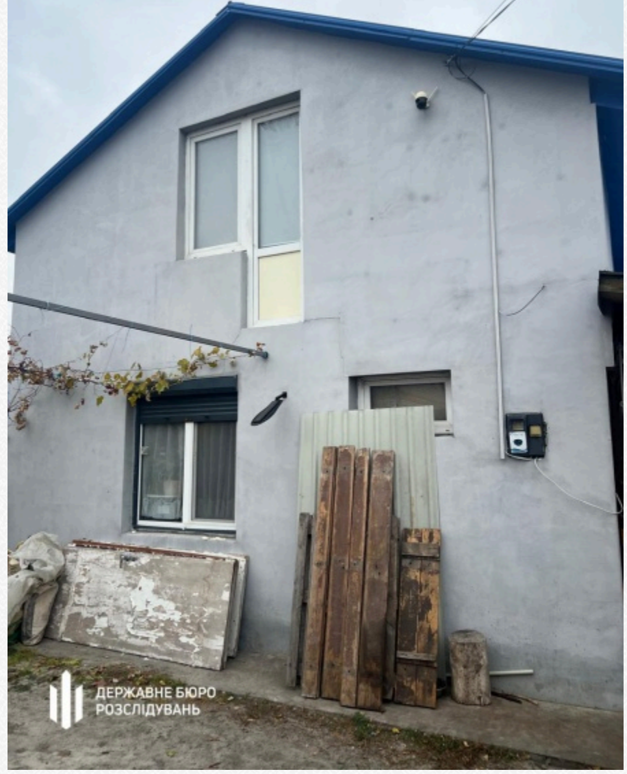
Державне бюро розслідувань