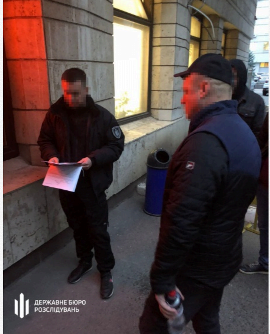
Державне бюро розслідувань