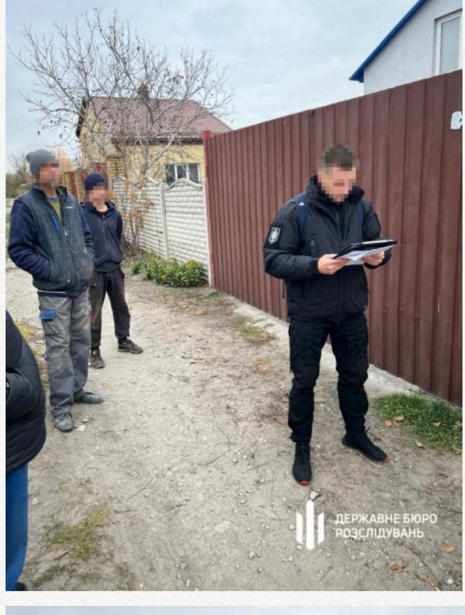
Державне бюро розслідувань