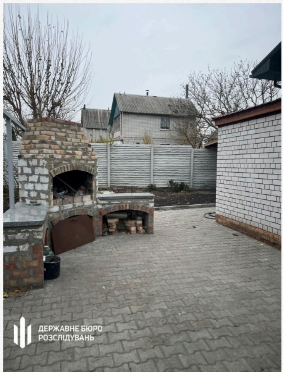
Державне бюро розслідувань

Командира затримали. Йому пред'явлено обвинувачення у перевищенні влади та службових повноважень, скоєному в умовах воєнного стану, що спричинило тяжкі наслідки (ч. 5 ст. 426-1 КК України). Підполковнику загрожує до 12 років позбавлення волі.