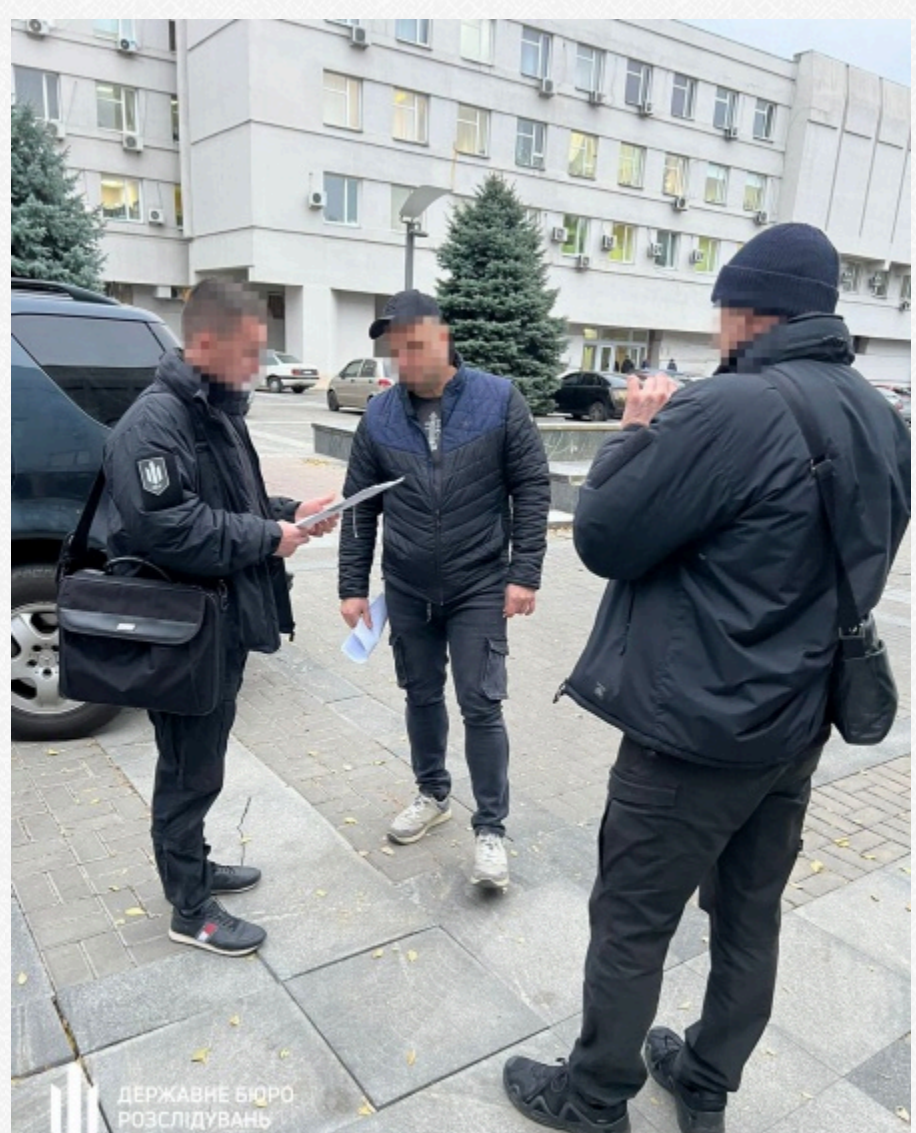
Державне бюро розслідувань