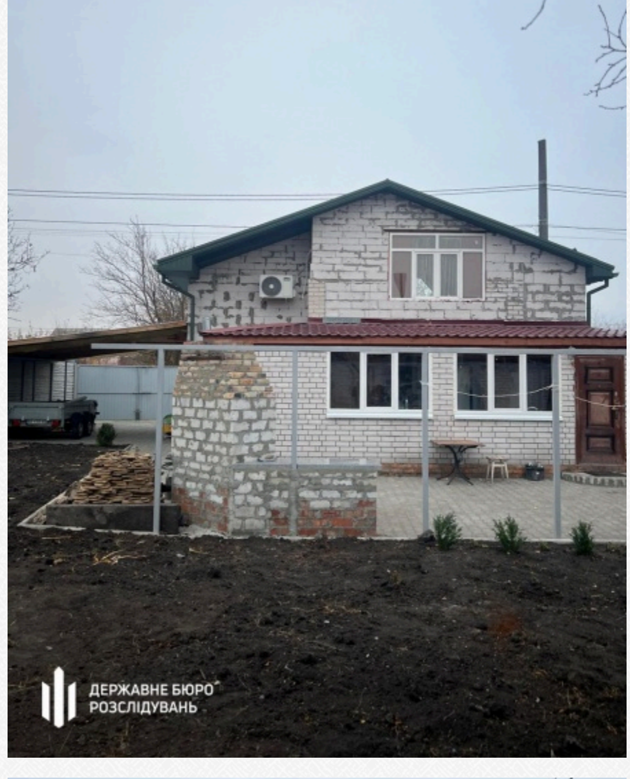
Державне бюро розслідувань