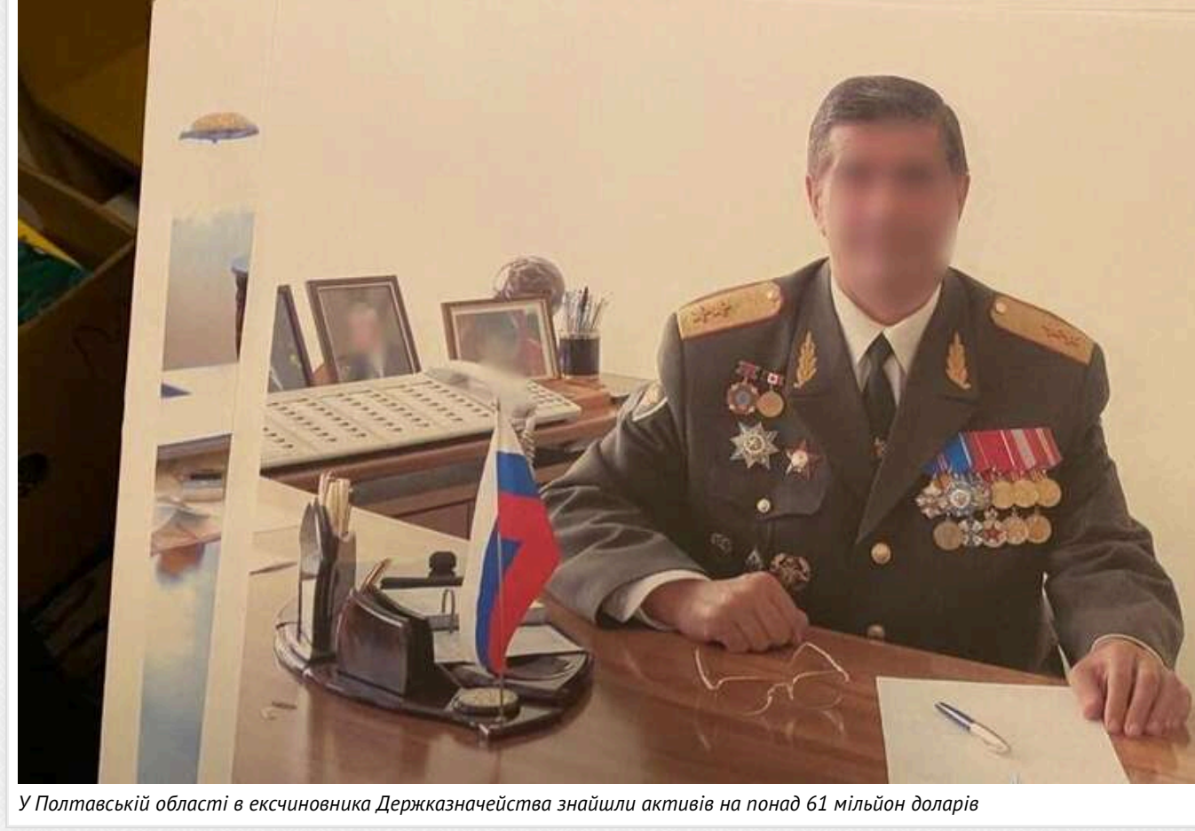
У Полтавській області в ексциновника Держказначейства знайшли активів на понад 61 мільйон доларів

На Полтавщині у колишнього службовця Держказначейства виявили активи, які перевищують $61 млн, – повідомила Нацполіція.