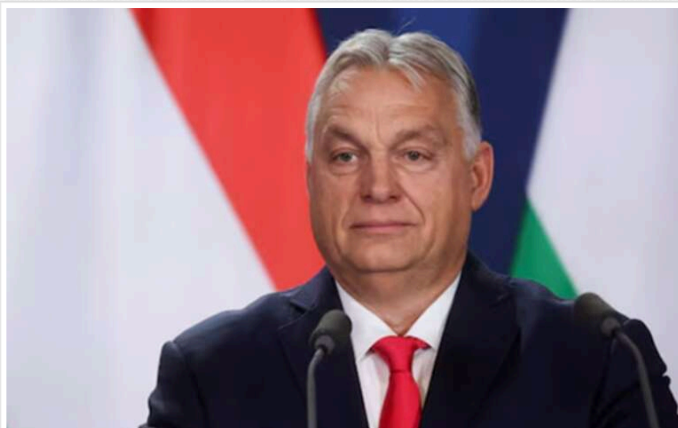
Орбан висунув пропозицію щодо перегляду енергетичних санкцій ЄС проти Росії

Євросоюзу слід переглянути санкції проти Росії, оскільки вони підтримують високі ціни на енергоносії, підриваючи економічну конкурентоспроможність блоку.