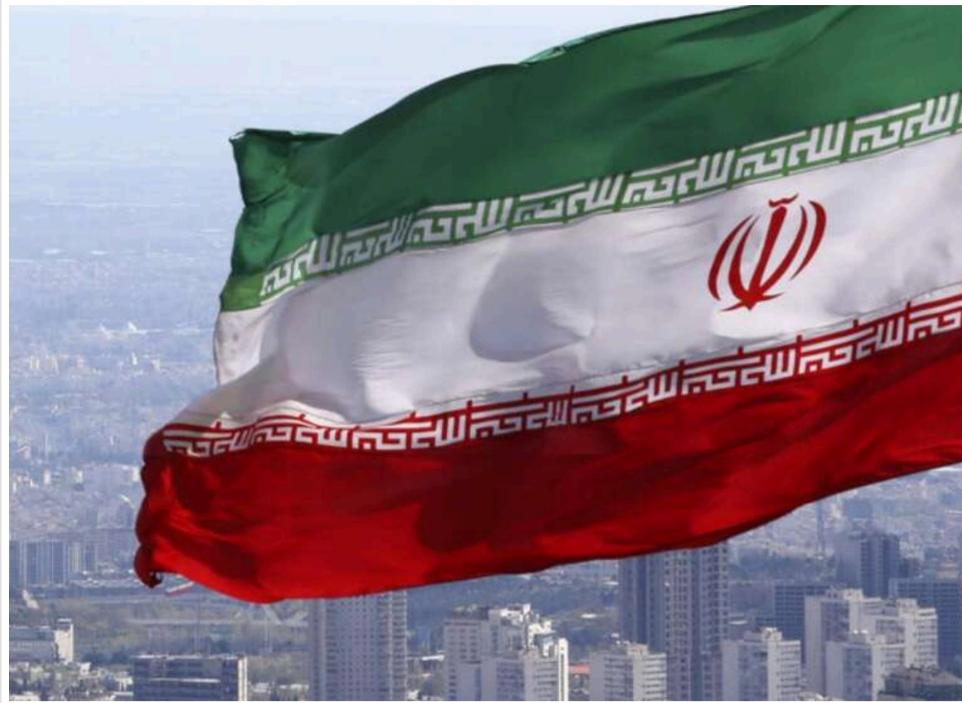
WSJ: В Ірані запевняють Білий дім, що не мали наміру вбивати Трампа

Минулого місяця Іран надав Білому дому письмові запевнення в тому, що не намагався вбити обраного президента США Дональда Трампа, повідомляє WSJ.