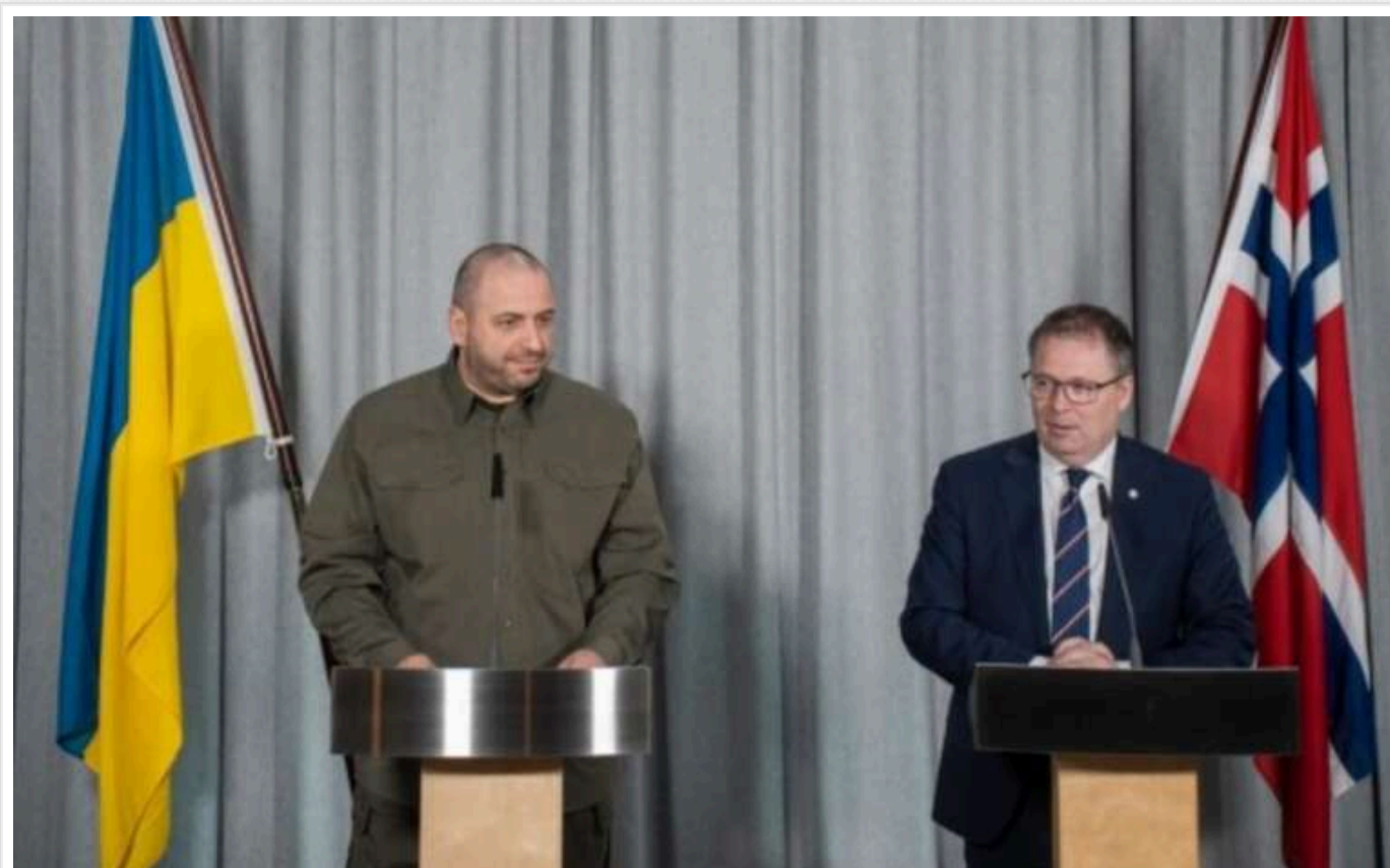
Умеров: Норвегія планує безпосередньо фінансувати виробництво зброї в Україні

Норвегія приєднається до "данського формату" підтримки - прямого фінансування виробництва українського озброєння та техніки.