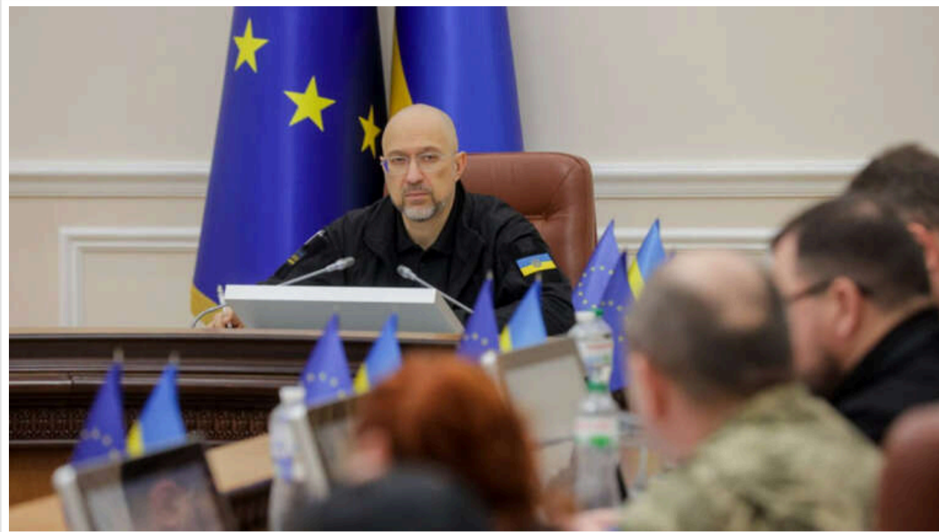
Кабмін затвердив дату початку виплат "тисячі Зеленського"

Кабінет Міністрів з 1 грудня запровадить зимову програму "єПідтримка": кожен мешканець України матиме можливість отримати тисячу гривень для оплати вітчизняних послуг і товарів.