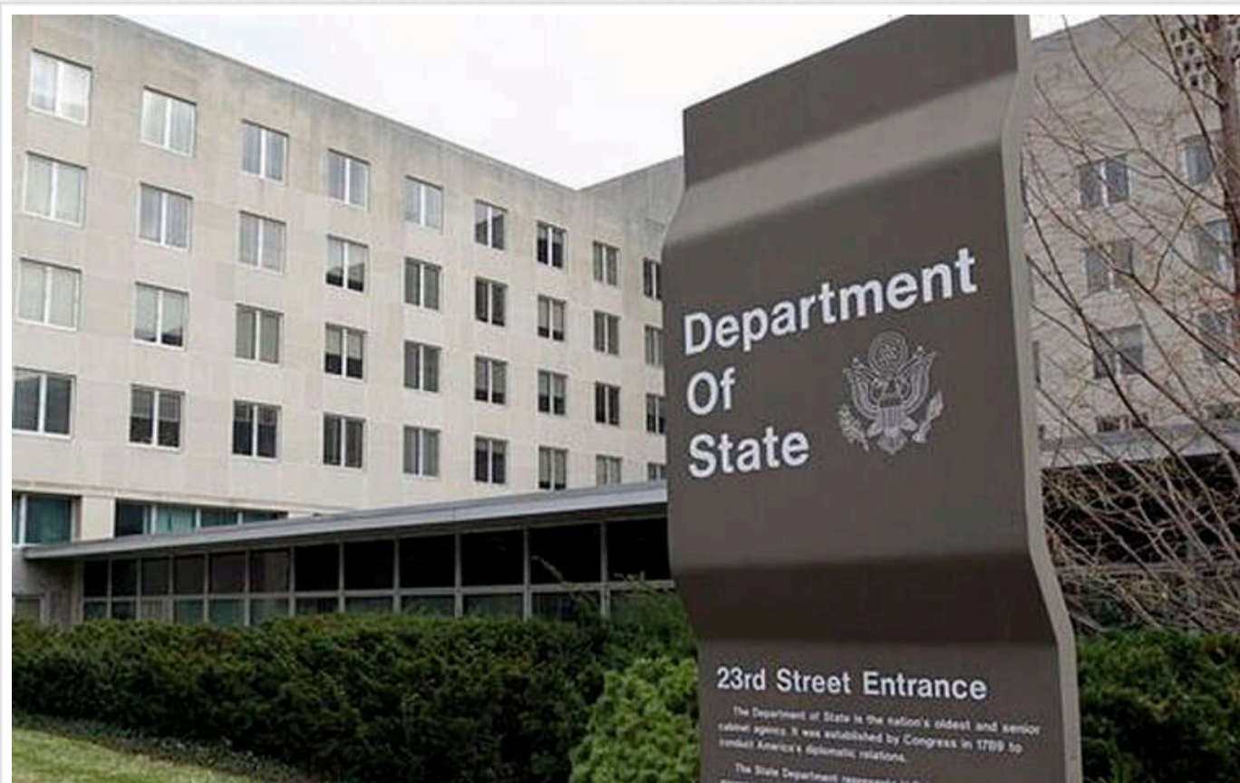
Державний департамент США радить утриматися від поїздок в Україну

Як і раніше наполегливо радять «унікати поїздок у прифронтові області України та райони, що прилягають до кордону з Білоруссю».