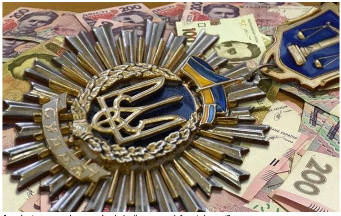
Справедливість чи корупція: чому українські суди підтримують недобросовісні компанії?

«Не тому що-небудь є справедливим, бо воно законне, навпаки: законом має бути лише те, що є справедливим» (Ш. Монтеск'є).