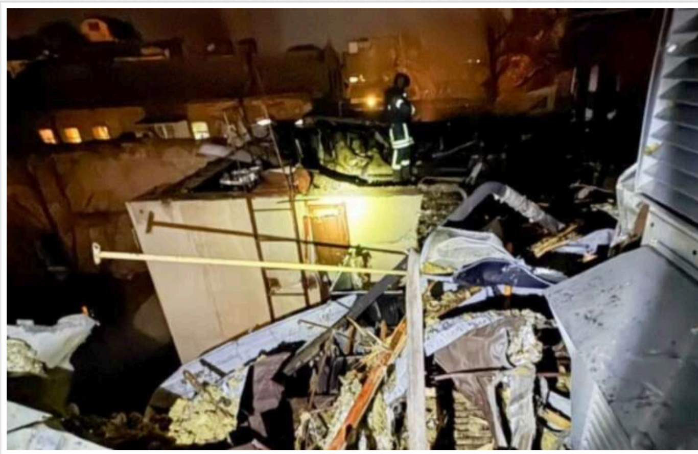
Зеленський відреагував на чергові удари Росії: в Одесі серед потерпілих – двоє дітей

Президент Володимир Зеленський заявив, що серед постраждалих внаслідок російського удару по Одесі - двоє дітей.