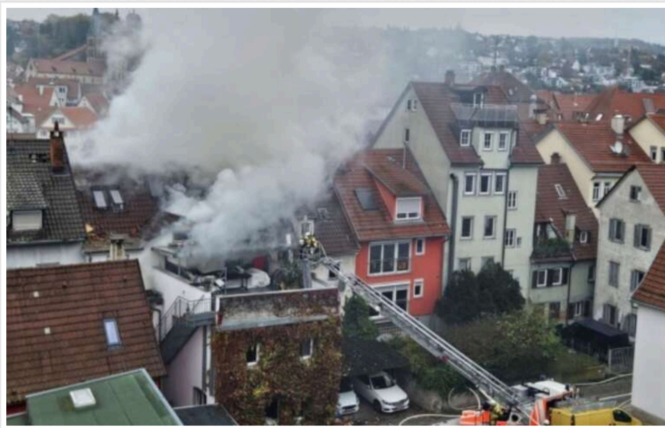
У Німеччині суперечка щодо оренди квартири закінчилася смертю двох осіб

У місті Есслінген в Німеччині під час конфлікту між орендарем квартири та орендодавцем сталася стрілянина та виникла пожежа, внаслідок чого загинуло двоє людей.