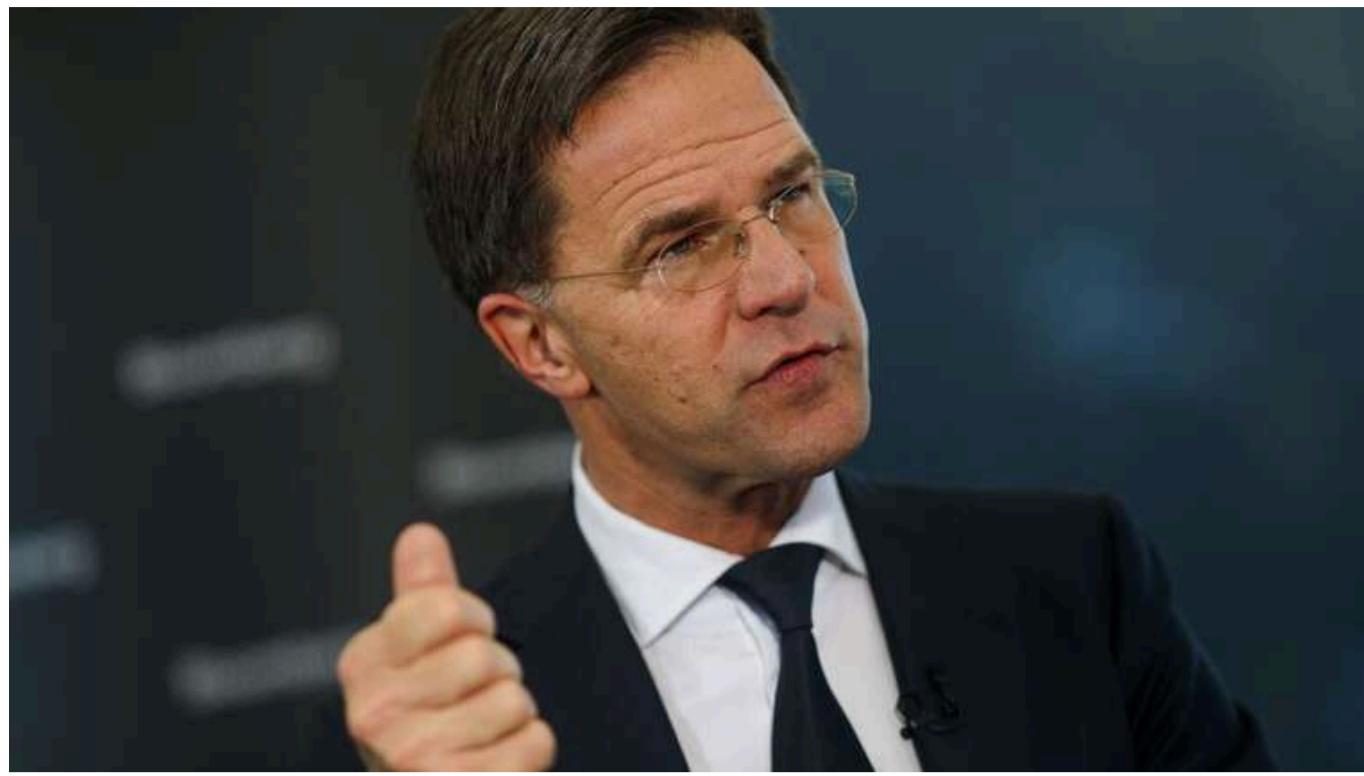
НАТО повинно сприяти Україні в завершенні війни з Росією шляхом переговорів, але з позиції сили, - Рютте

Тільки Україна має право визначити, коли розпочати переговори з Росією щодо завершення війни. Водночас союзники по НАТО мають продовжувати надавати Україні військову допомогу, щоб вона могла вести переговори з позиції сили.