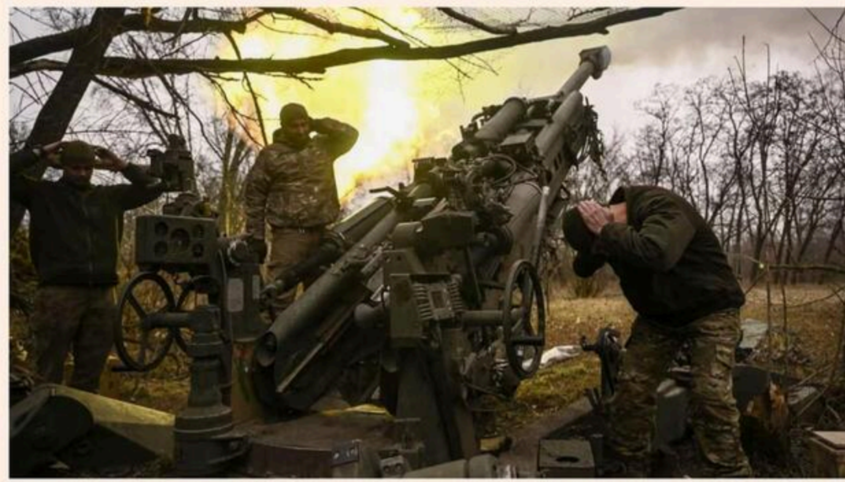
Bond investors are betting that Ukraine will be prepared to accept a peace deal

Rally in dollar debt is unlikely 'Trump trade' and comes just months after huge restructuring