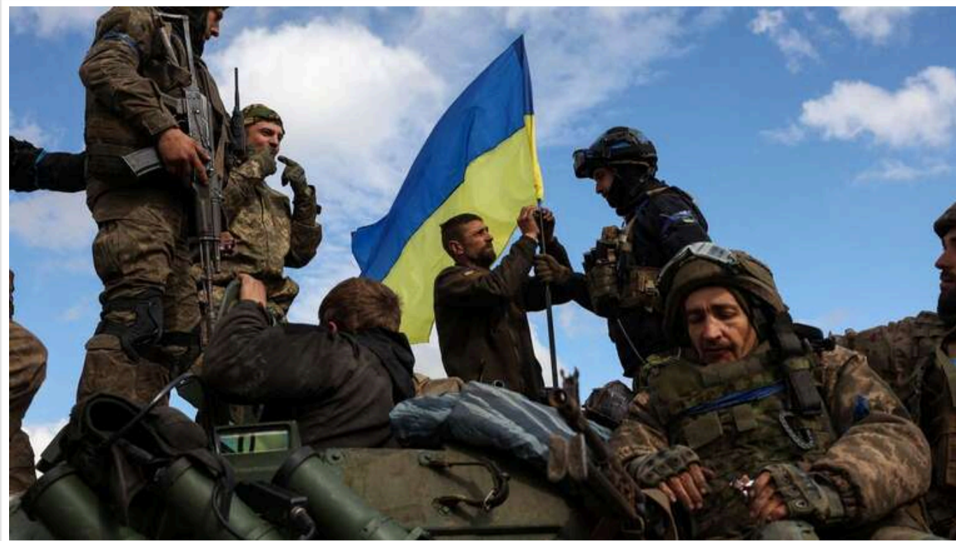
Інвестори роблять ставки на завершення війни в Україні

Українські доларові облігації за місяць зросли на 12% через очікування інвесторів, що Трамп завершить війну.