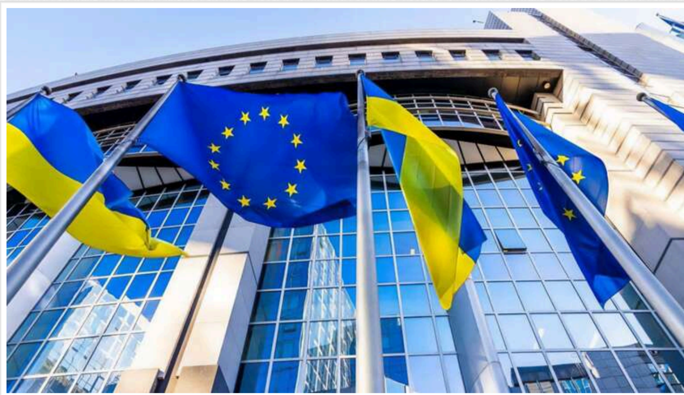
Європейська комісія затвердила виділення Україні траншу на суму 4 мільярди євро

Європейська комісія затвердила виділення 4 млрд євро макрофінансової допомоги Україні у вигляді грантів та позик в рамках програми Ukraine Facility.