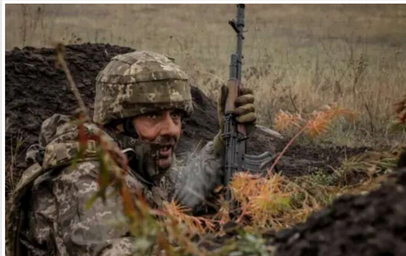
До оточення ЗСУ на південь від Курахового залишилося менше 6 кілометрів, - DeepState