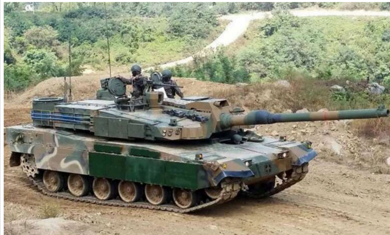
Польща перемістила до кордону з РФ перші південнокорейські танки

Польща перемістила південнокорейські танки K2 до кордону з Росією. Мова йде про перші сім одиниць.