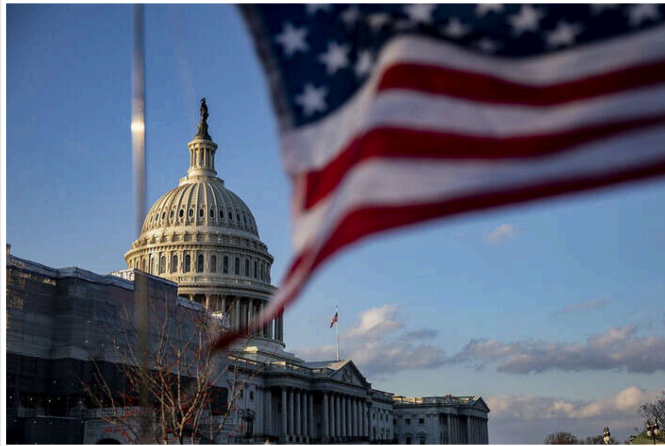
У Конгресі США вважають, що є "шанс" для затвердження нової допомоги Україні до приходу Трампа

У Сенаті США вбачають можливість схвалення додаткового фінансування для України на 2025 рік. Це прагнуть зробити перед поверненням Дональда Трампа до Білого дому.