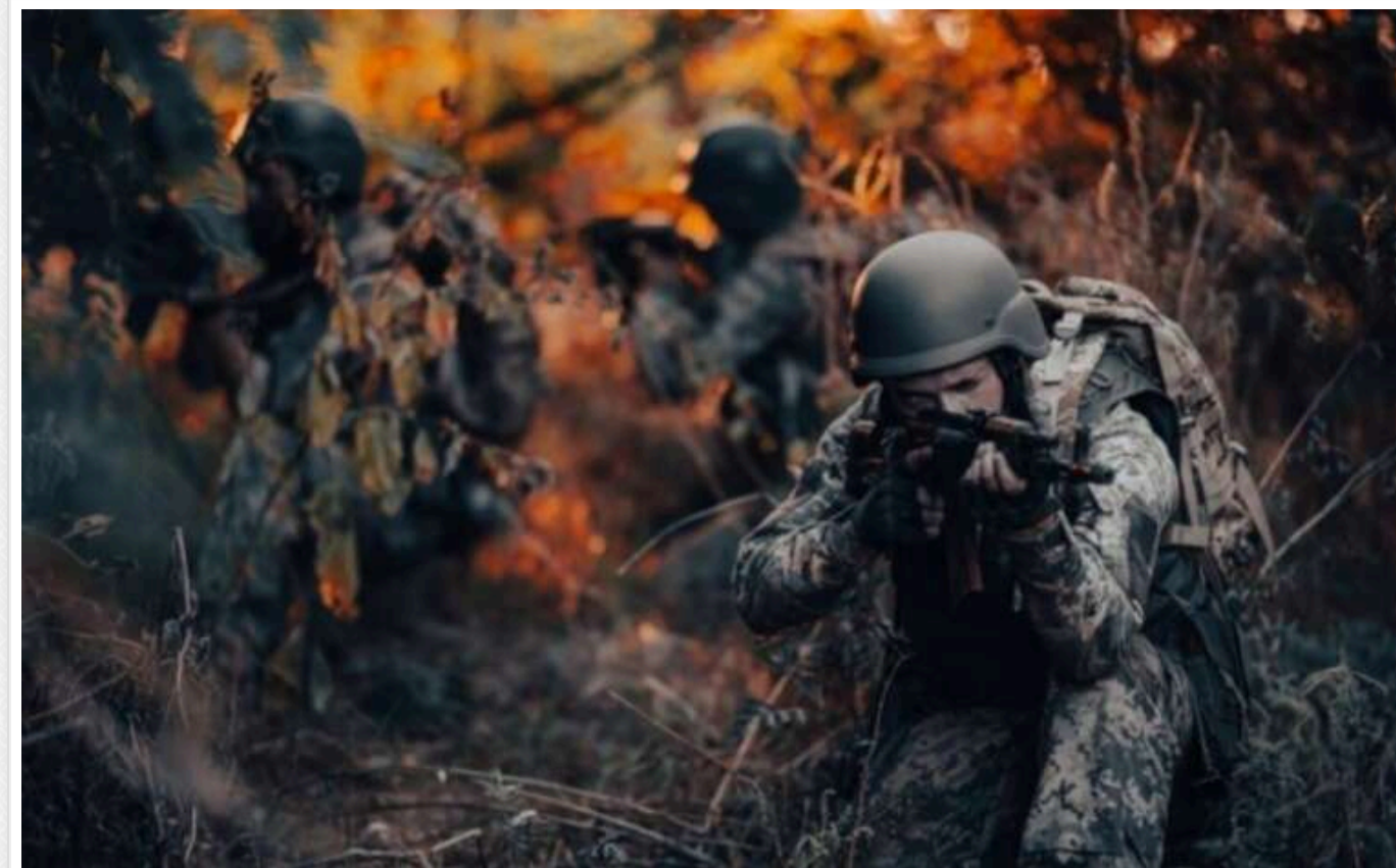
У Генштабі назвали найгарячіші напрямки фронту: з початку доби відбулося 88 бойових зіткнень

З початку доби на фронті сталося 88 бойових зіткнень. Українські Сили оборони продовжують стримувати наступ російських окупантів.