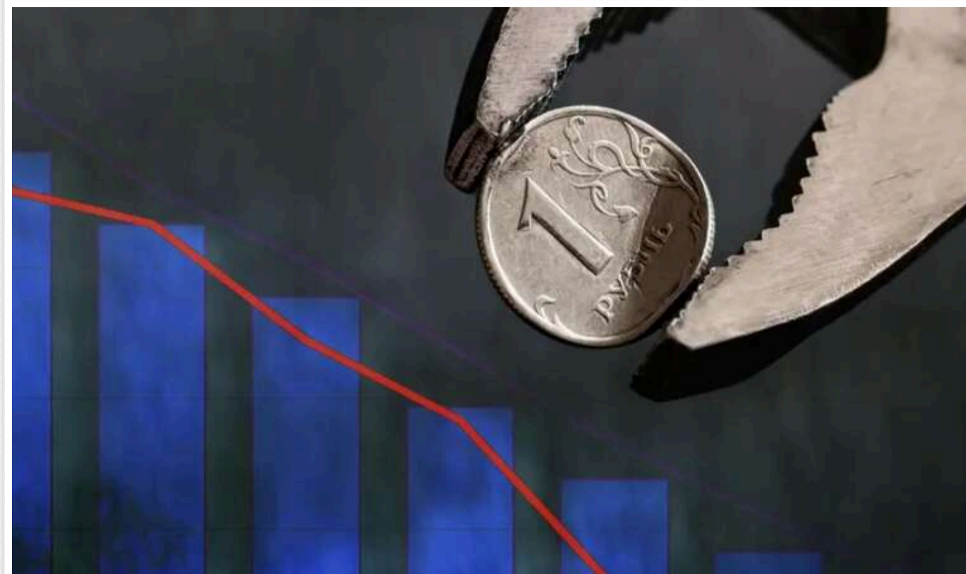
РФ опинилася на межі валютного "полювання на відьом"

Російська валюта просідає останні кілька місяців, що змусило експертів шукати винних у тому, що відбувається. Деякі з них дійшли висновку, що причиною обвалу рубля можуть бути місцеві банки.