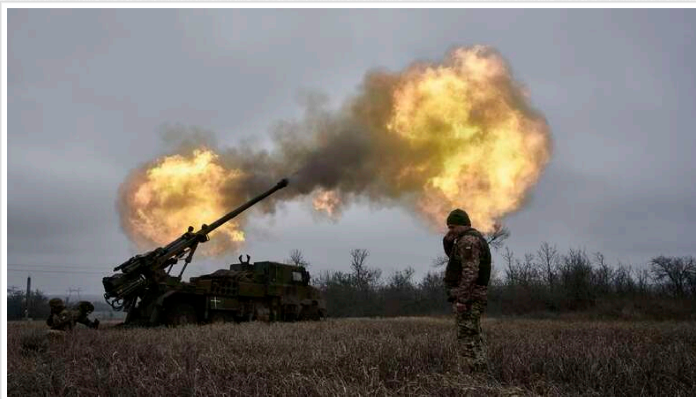
На Времівському напрямку війська РФ наразі активно наступають з використанням підготовлених груп штурмовиків

Про це повідомив речник Сил оборони півдня Владислав Волошин.