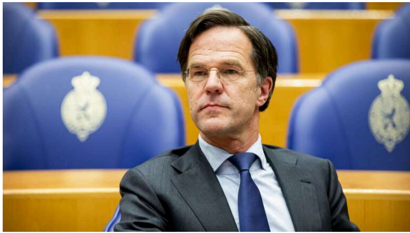
Рютте переконаний у підтримці Трампом НАТО та зобов'язань Альянсу

Генеральний секретар НАТО Марк Рютте переконаний, що новообраний президент США Дональд Трамп усвідомлює важливість членства США в НАТО.