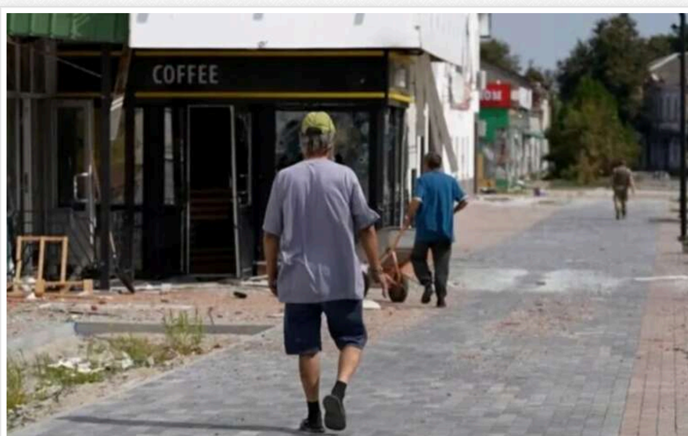
Російські пропагандисти "спалили" своїх мародерів, які грабують села на Курщині

Російські пропагандисти здали своїх мародерів у Курській області. Вони розповіли про пограбовані будинки нібито українськими військовими в селищі, в яке ЗСУ ніколи не заходили.