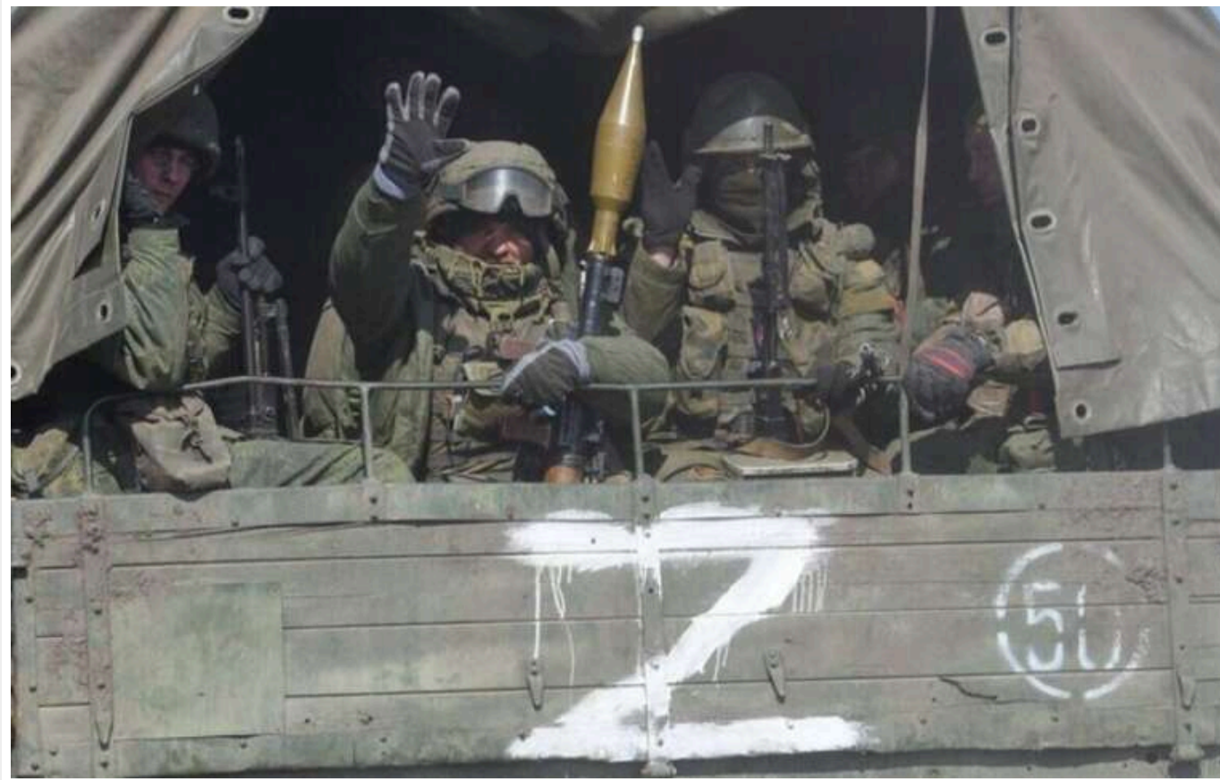
Росіяни переміщують на Курщину найбоєздатніші підрозділи

У Курській області, де триває операція Сил оборони України, росіяни планують поновити ведення наступальних штурмових дій. Аби поповнити значні втрати у живій силі, РФ перекидає туди свою 76-ту десантно-штурмову дивізію.