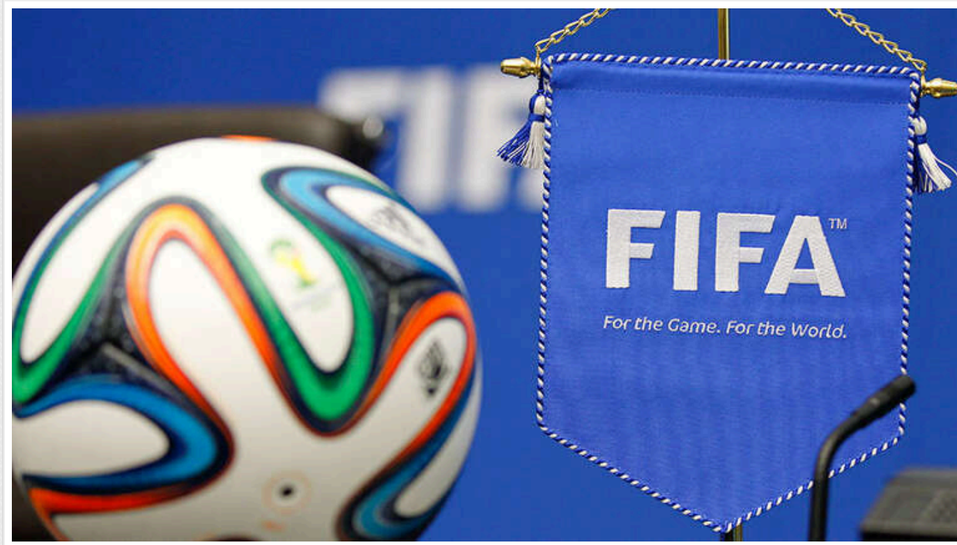
ФІФА планує впровадження революційної зміни у футбольних правилах

Міжнародна федерація футболу (ФІФА) планує вперше в історії дозволити тренерам вимагати відповісти. ФІФА очікує на дозвіл Міжнародної ради футбольних асоціацій (IFAB) для продовження тестування системи підтримки відео у футболі (FVS), яка є альтернативою VAR і надасть тренерам можливість оскаржити рішення.