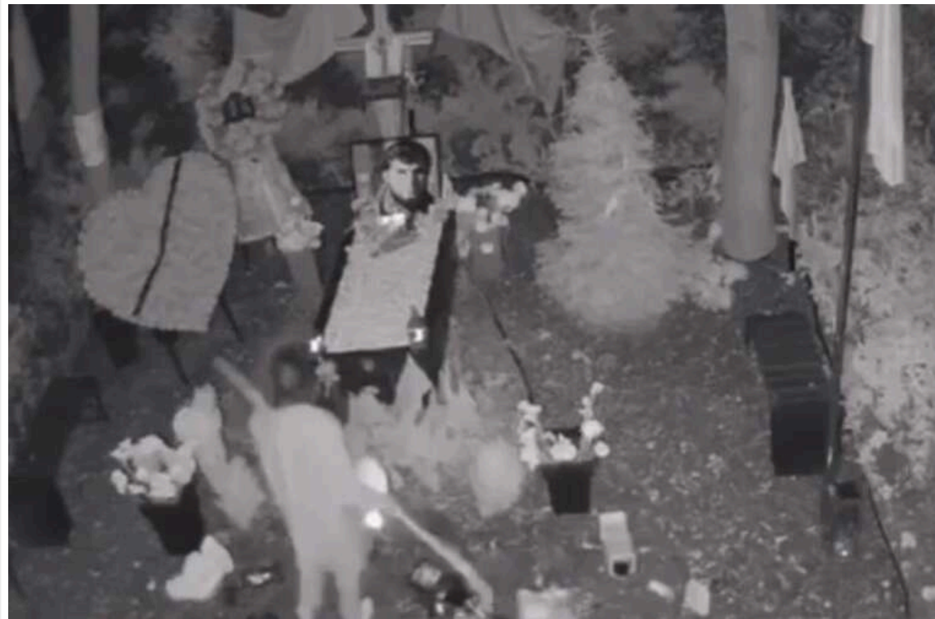
Підозрювана у нарузі над могилами «Да Вінчі» та «Джуса» через психічні розлади не усвідомлювала свої дії

Наразі до неї застосовано запобіжний захід у вигляді поміщення до закладу з надання психіатричної допомоги в умовах, що виключають небезпечну поведінку особи.