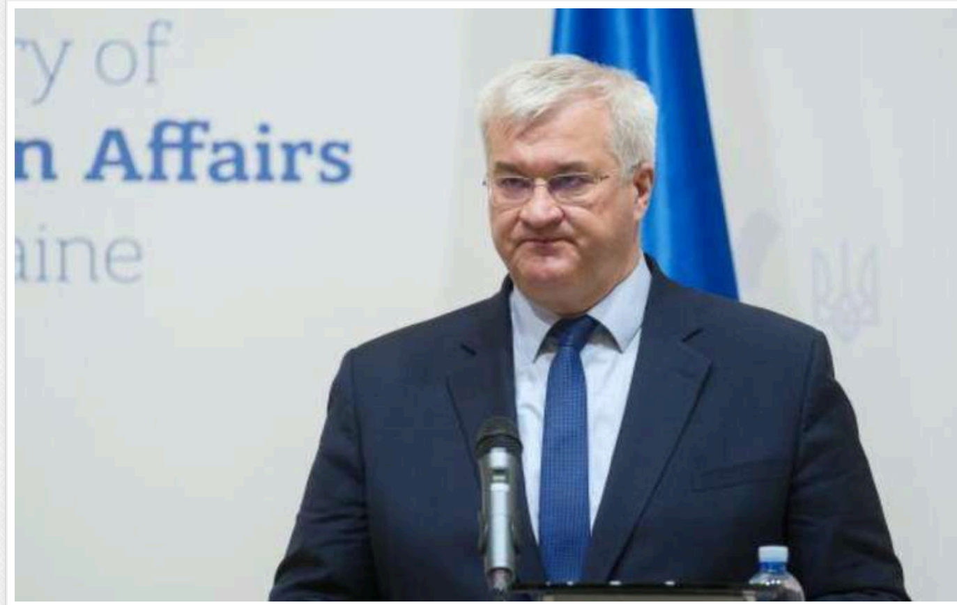
Сибіга напередодні саміту G20 підкреслив важливість принципу "нічого про Україну без України"

Україна має чітку позицію щодо досягнення справедливого миру. Київ не погодиться на жодну ініціативу, розроблену без її участі.