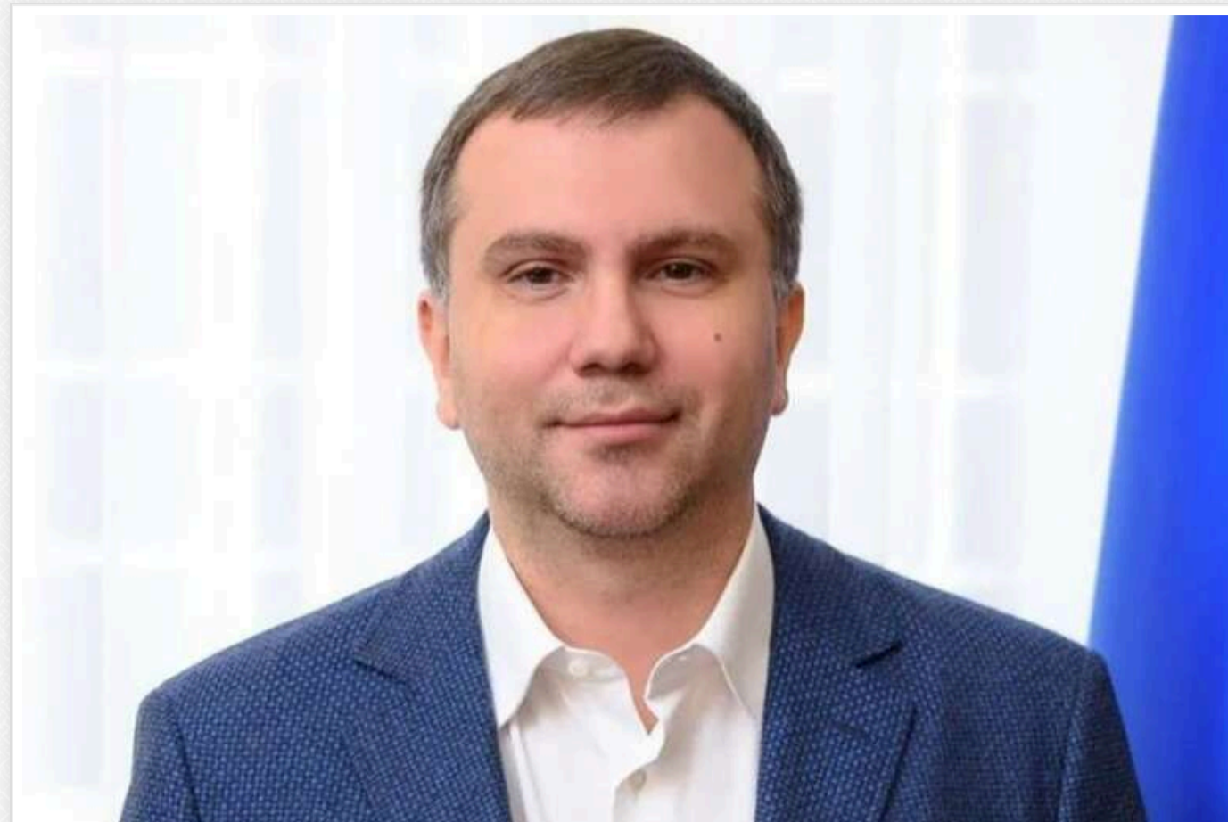
Скандального суддю Вовка відсторонили від виконання суддівських обов'язків

Скандального суддю Павла Вовка тимчасово усунуто від виконання обов'язків правосуддя. Це рішення прийнято на основі рішення Третьої Дисциплінарної палати ВРП.