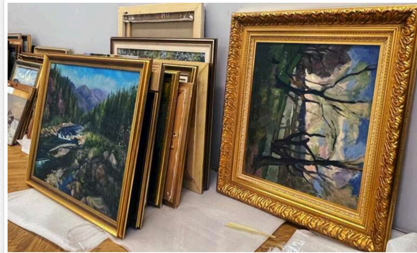
АРМА реалізувало перші арештовані картини зрадника Медведчука: виручено майже 320 тисяч гривень

Агентство з розшуку та менеджменту активів (АРМА) успішно здійснило продаж перших 16 картин із конфіскованої колекції державного зрадника Віктора Медведчука через систему Прозорро.Продажі. Загальна сума, отримана від продажу цих картин, склала майже 317 тисяч гривень.