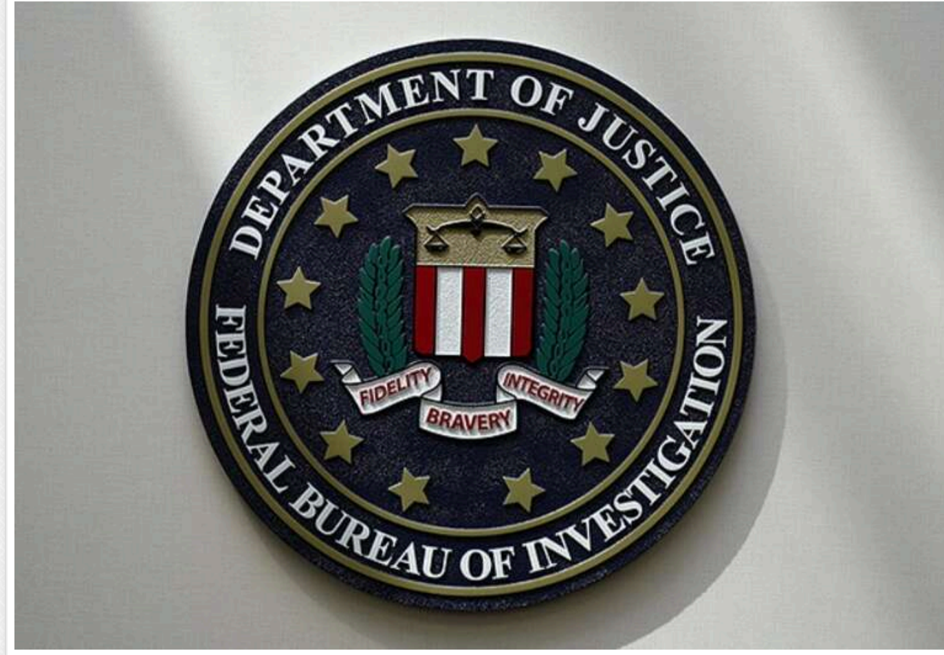
Затримано співробітника ЦРУ, який поширив засекречену інформацію про напад Ізраїлю на Іран, - NYT

За інформацією видання The New York Times , агенти ФБР затримали в Камбоджі людину, яку підозрюють у витоку секретних документів Міністерства оборони США, що містять дані про підготовку ізраїльської відповіді на удар по Ірану.