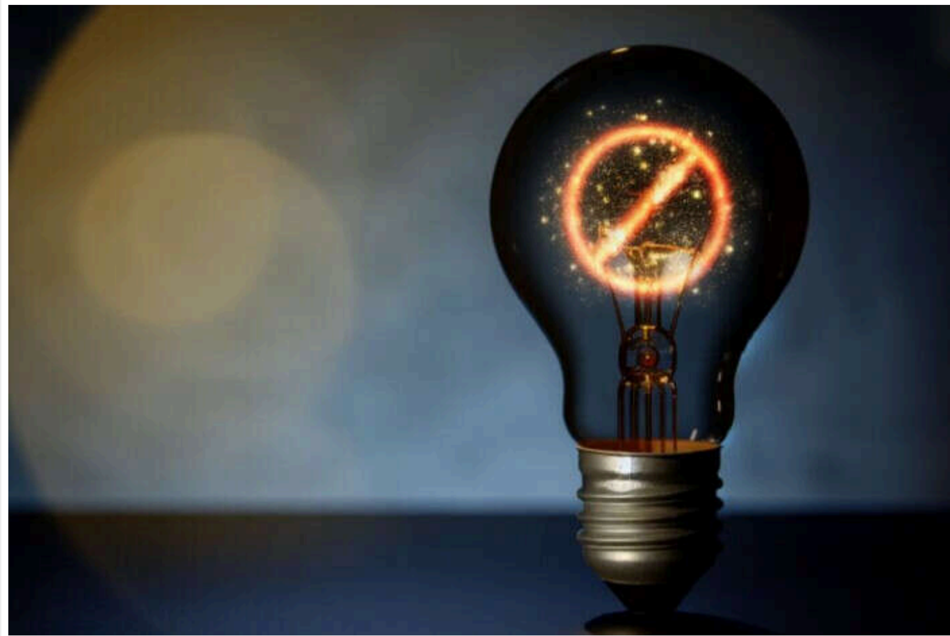
В "Укренерго" скасували відключення світла для бізнесів

Тимчасові обмеження на потужність для бізнесу та промисловості було скасовано. Їх запровадили 13 листопада з метою подолання дефіциту потужності в енергосистемі.