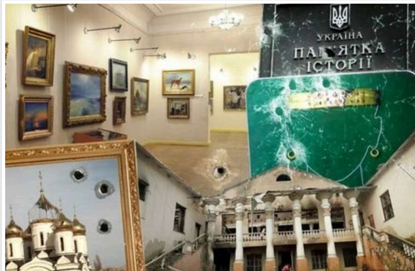
Які культурні об'єкти на Херсонщині були безповоротно втрачені через дії загарбників

Розграбовані музеї, розстріляні церкви, знищені унікальні об'єкти архітектури та археології. За даними Міністерства культури та стратегічних комунікацій України, внаслідок російської агресії пошкоджено близько 1200 об'єктів культурної спадщини. Ця цифра щодня лише зростає.