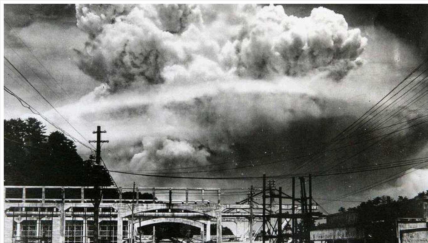
Україна здатна протягом кількох місяців розробити елементарний варіант ядерної зброї