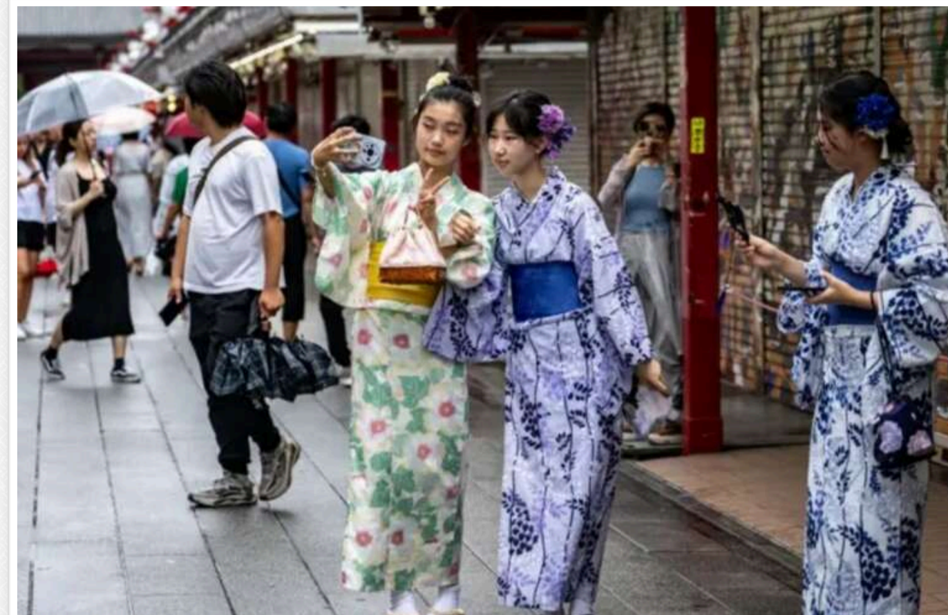
В Японії з метою стимулювання народжуваності запропонували ввести заборону на шлюб для жінок після 25 років