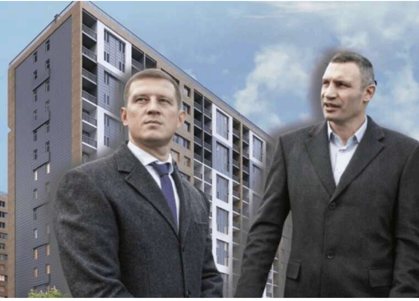
«Спецжитлофонд» визначив підрядників для будівництва житлового комплексу на вулиці Качалова на суму 1 мільярд гривень

КП «Спецжитлофонд» за 1 млрд бюджетних гривень замовило продовження будівництва житлового комплексу (ЖК) на вул. Качалова, 40, який давно зводять там на місці колишніх складів.