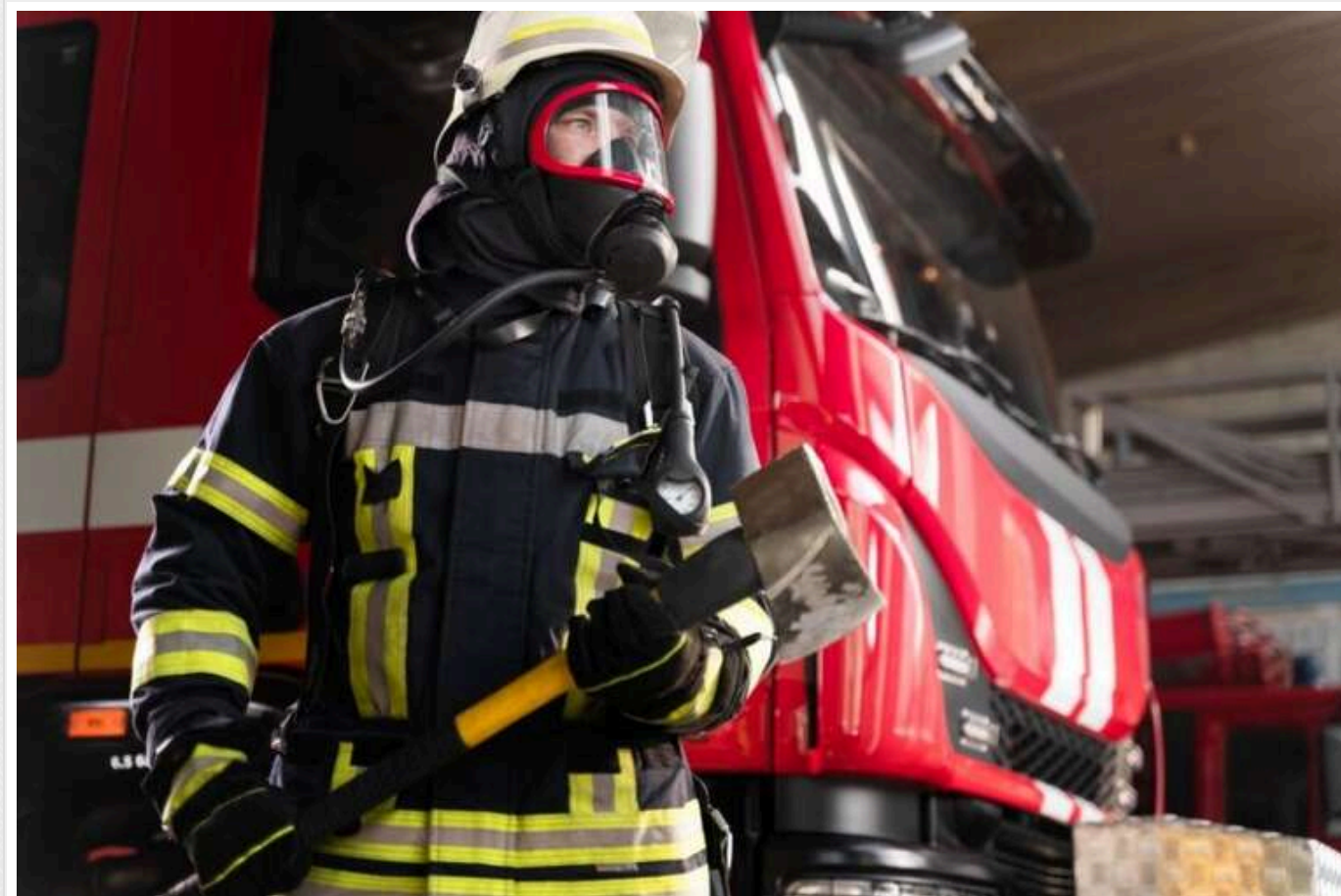
Окупанти атакували Харків: на місці прильоту поряд з ТЦ пошкоджено понад двадцять припаркованих машин

Росіяни завдали удару дроном біля торговельного центру в Харкові.