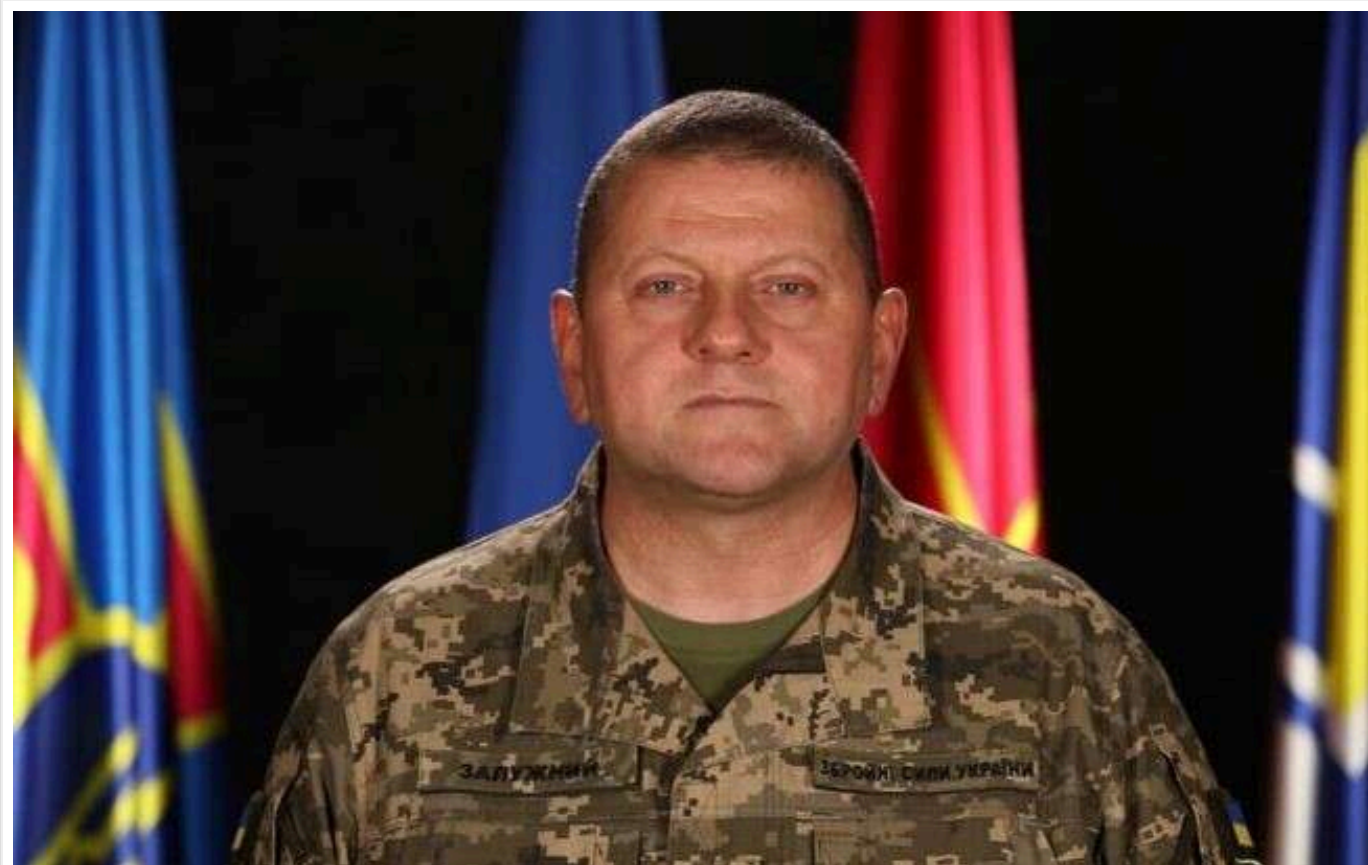
The Economist: Якщо президентські вибори в Україні відбудуться найближчим часом, Зеленський може поступитися в другому турі Залужному

Якщо в Україні найближчим часом відбудуться президентські вибори, Зеленський може зазнати поразки в другому турі від експолікомандувача ЗСУ Залужного, якщо він вирішить балотуватися.