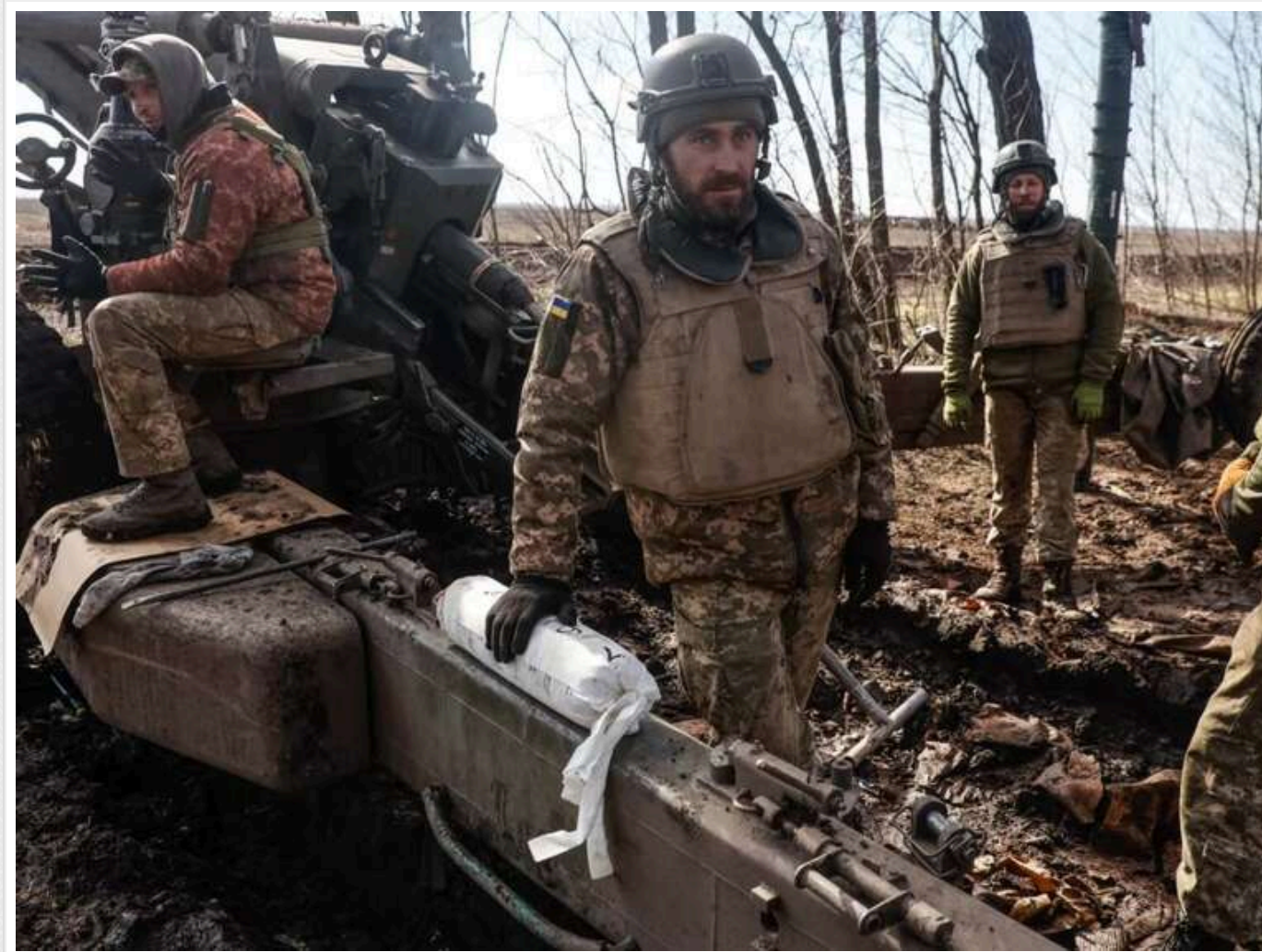
ЗСУ «готові відступити» з Курахового, «але поки немає наказу згори», - FT

Українські війська «готові відступити» з Курахового, «але поки немає наказу згори». Про це газеті Financial Times повідомив один із українських командирів-артилеристів.