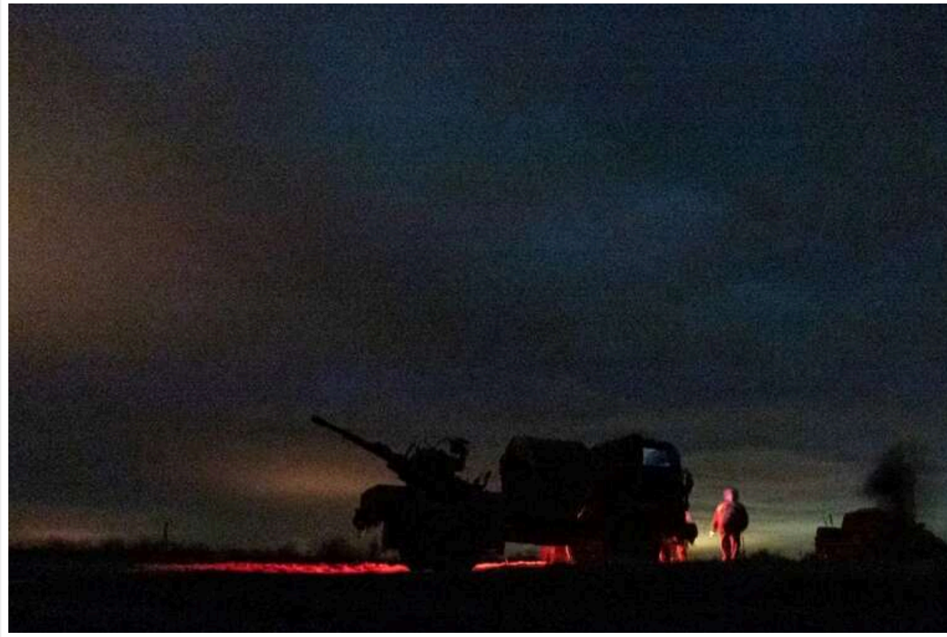
Окупанти атакували Україну: сили ППО знищили 37 дронів-камікадзе та 4 ракети

У ніч на 13 листопада Росія здійснила нову атаку на Україну. На українські міста та села летіла майже сотня засобів повітряного ураження ворога, зокрема ракети та дрони різних типів.