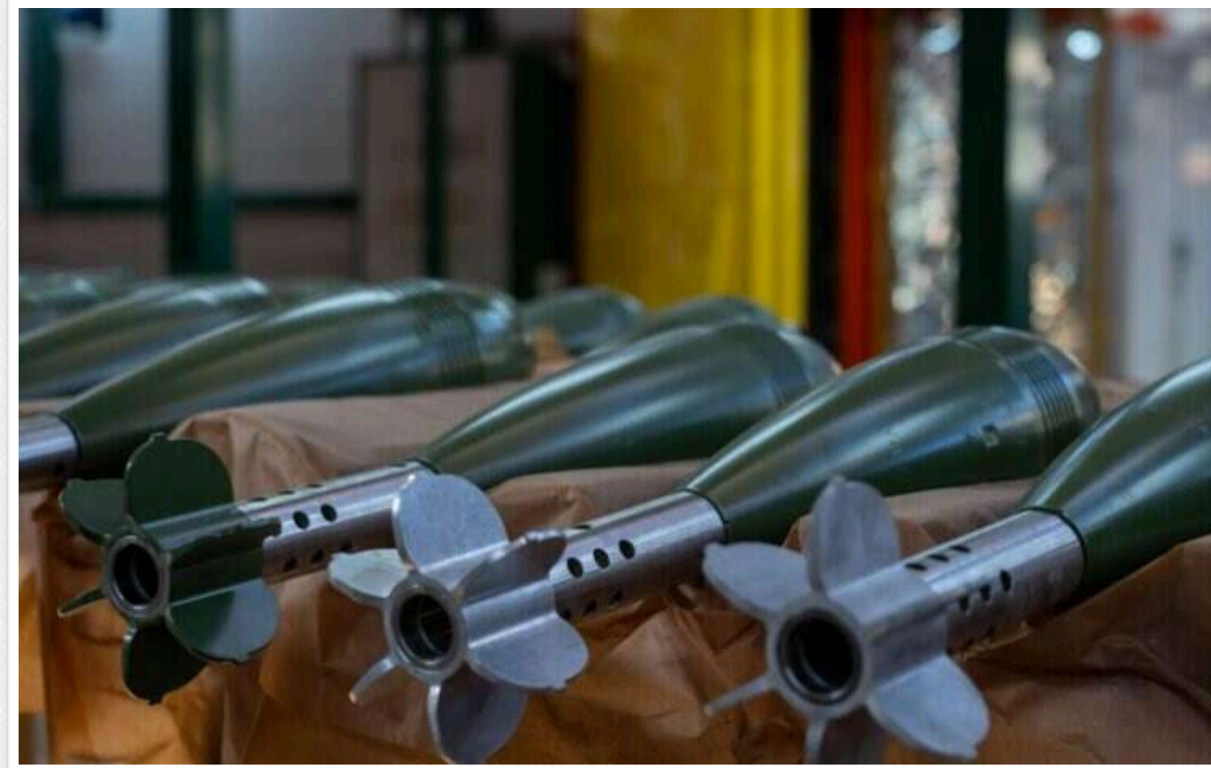
У Кабміні затвердили 55 мільярдів гривень на виробництво зброї в 2025 році

Уряд України схвалив проєкт державного бюджету на 2025 рік, у якому заплановано виділити понад 55 мільярдів гривень на розвиток виробництва озброєння та військової техніки.