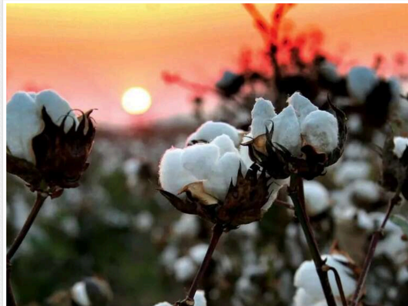
Генштаб: ЗСУ завдали ударів по складу з паливом у Белгородській області

Українські сили оборони вразили склад паливно-мастильних матеріалів у Белгородській області вночі, 12 листопада. На території об'єкта спалахнула пожежа.