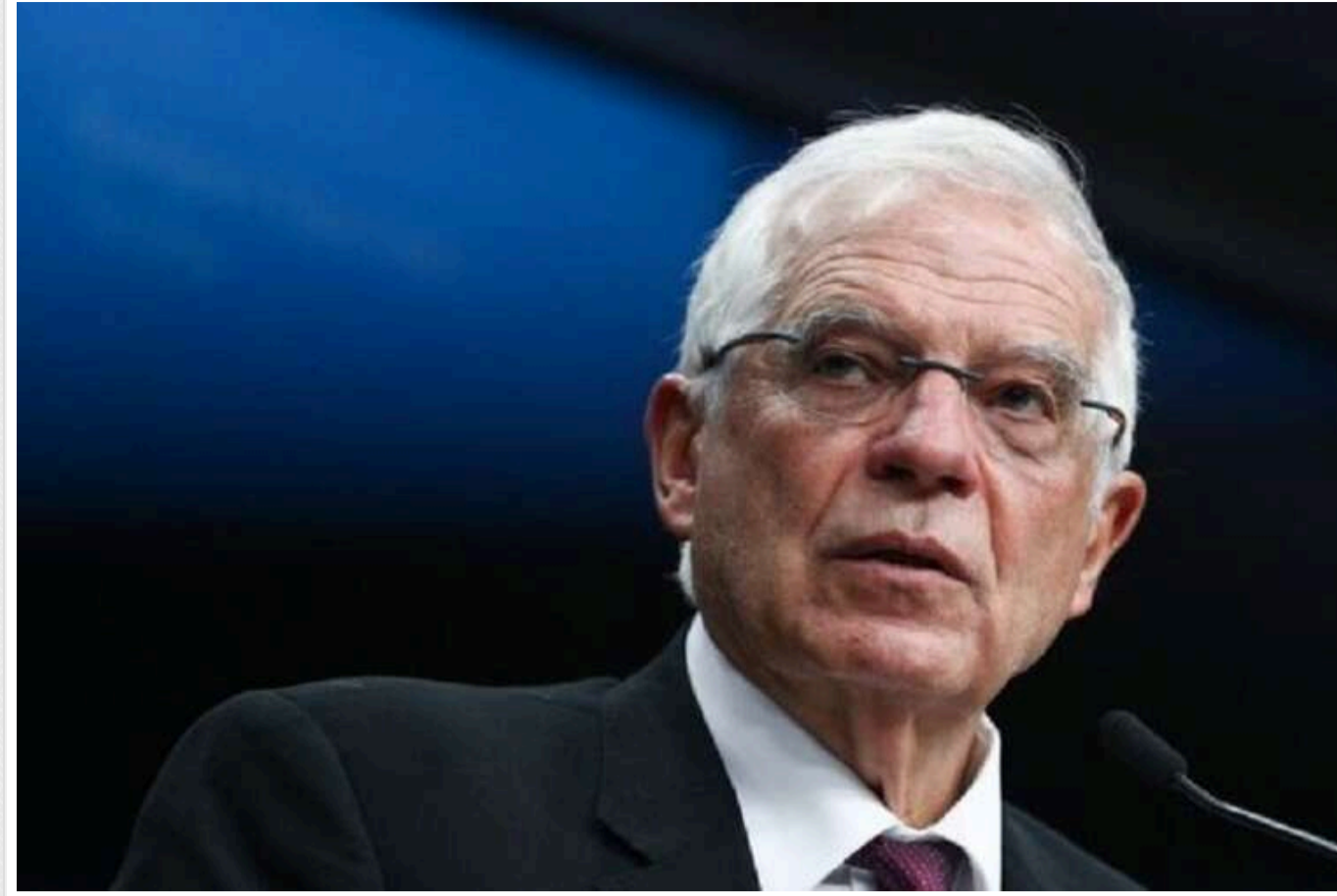
Боррель не виключив, що Європі доведеться збільшити допомогу Україні

Високий представник Європейського Союзу з питань зовнішньої політики та політики безпеки Жозеп Боррель заявив, що ЄС повинен "розглянути новий сценарій" у контексті допомоги Україні. У разі перемоги Дональда Трампа на президентських виборах у США, Європі доведеться збільшити підтримку офіційному Києву.