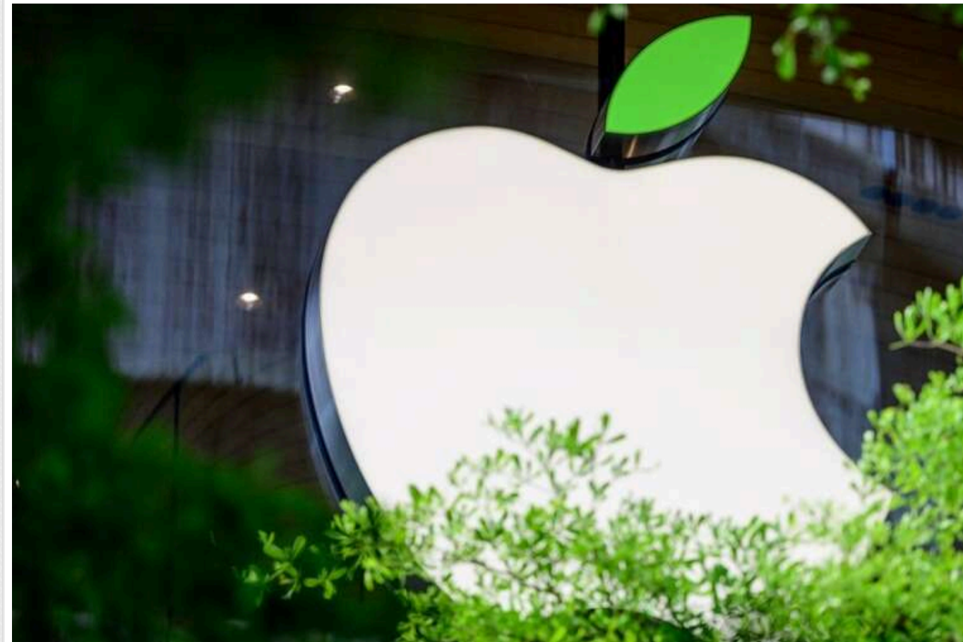
Компанія Apple хотіла зареєструвати в Україні торгову марку "Яблоко": отримали відмову

Одна з найбільших компаній у світі Apple Inc не зможе зареєструвати в Україні власну торговельну марку "Яблоко". Міжнародний техногігант отримав відмову вже вдруге з 2021 року.